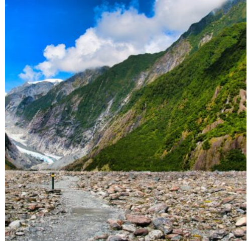
Franz Josef Gletscher

Nicht nur Vulkane und Geysire prägen die Inseln Neuseelands, auch Gletscher formten das Land. Mit dem Franz Josef-Gletscher tauchen Sie heute ein in eine Welt aus Eis. Unternehmen Sie eine geführte Wanderung zur Gletscherzunge, wo Eis auf Stein und Erde trifft, und entdecken Sie, wie der mächtige Gletscher die Landschaft gestaltete. Eine Führung über das Gletschereis präsentiert Ihnen die gewaltige Urgewalt, die das Eis entwickelt. Um den Gletscher aus einer einmaligen Perspektive zu entdecken, empfiehlt sich ein Helikopterrundflug (witterungsbedingt). Im Gletscherdorf Franz Josef leiten Sie in Ruhe den Abend ein. (F)