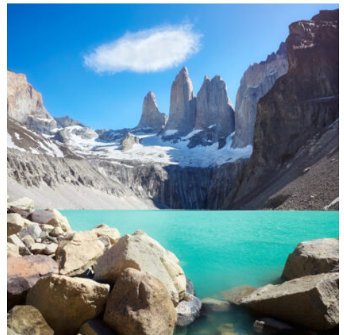
Torres del Paine

Ein spektakulärer Ausflug zum berühmten Perito Moreno Gletscher im Nationalpark Los Glaciares steht auf dem Programm. Nach einer malerischen Fahrt durch den Park erreichen Sie den beeindruckenden Lago Argentino, in den der Perito Moreno Gletscher hineinwächst. Die imposante Gletscherfront des Perito Moreno Gletschers ist 5 km lang und 70 m hoch. Jeden Tag brechen kleinere Eisstücke von der Gletscherwand ab und fallen mit lautem Getöse ins Wasser. Sie haben genügend Zeit, dieses faszinierende Naturschauspiel zu beobachten und das ständige Kalben des Gletschers zu erleben. Nutzen Sie die Gelegenheit, die verschiedenen Aussichtspunkte zu erkunden und die beeindruckenden Kräfte der Natur aus nächster Nähe zu beobachten. (F)