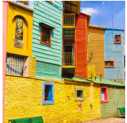
Buenos Aires - La Boca

Ankunft in Buenos Aires und anschließender Transfer ins Hotel.