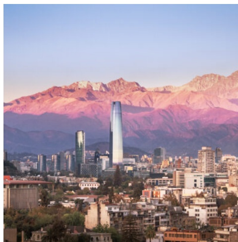
Santiago de Chile

Sie werden von Ihrem Hotel zum Flughafen von Punta Arenas gebracht und fliegen weiter nach Puerto Montt. Nach Ihrer Ankunft werden Sie von Ihrer örtlichen Reiseleitung empfangen und zu Ihrem Hotel nach Puerto Varas gebracht. Die malerische Stadt liegt direkt am Ufer des Llanquihue-Sees und begeistert mit herrlichen Ausblicken auf den majestätischen Vulkan Osorno. (F)