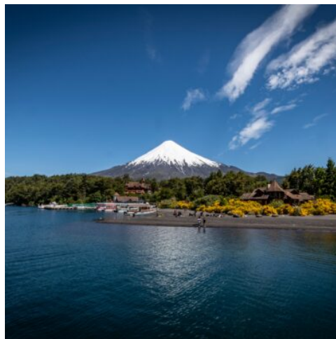
Todos los Santos See

Nach dem Frühstück brechen Sie zu einer eindrucksvollen Ganztagestour durch den spektakulären Torres del Paine Nationalpark auf. Die drei steil in den Himmel ragenden Granitspitzen „Torres del Paine“ sind wohl das bekannteste Bild Chiles. Die Tour führt Sie durch eine atemberaubende Landschaft aus glitzernden Seen, bizarren Bergformationen und schneebedeckten Gipfeln. Zu den Höhepunkten der Tour gehören ein Besuch der beeindruckenden Milodon-Höhle sowie des malerischen Salto Grande Wasserfalls. Genießen Sie die spektakulären Ausblicke auf die majestätischen Berge und die vielfältige Flora und Fauna des Parks. (F)