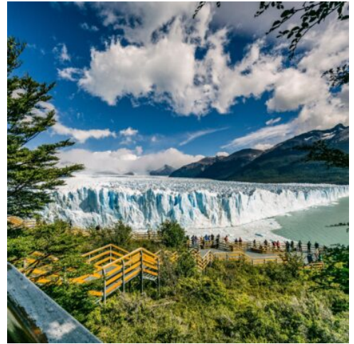
Perito Moreno Gletscher

Der Tierra del Fuego Nationalpark beeindruckt vor allem durch die besondere Vegetation Feuerlands mit Lengas-Wäldern, Farnen und Moosen. Er liegt im Südwesten der Provinz Tierra del Fuego, ist nur 11km von Ushuaia entfernt und grenzt beinahe an Chile. Während des Ausfluges sehen Sie die mächtigen Anden, die Ensenada Bucht und den Beagle Kanal. Am Nachmittag können Sie optional (buchbar vor Ort) einen Ausflug mit dem Katamaran auf den Beagle-Kanal und zur Insel Los Lobos unternehmen. (F)