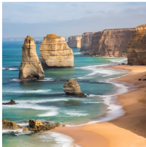
Great Ocean Road

Die Reise führt Sie weiter nach Sydney. Von hier aus machen Sie sich auf den Weg zu einer Tour in die Blue Mountains. Riesige Wälder, Sandsteinklippen, Schluchten und Wasserfälle machen die Region einzigartig. Von Ihrem Guide erfahren Sie Interessantes zu der Geschichte sowie der biologischen Vielfalt des Gebietes. Genießen Sie die spektakuläre Aussicht über das Jamison Valley und auf die berühmten Three Sisters. Die beeindruckenden Sandsteingipfel ragen über 900 m in die Höhe. (F)