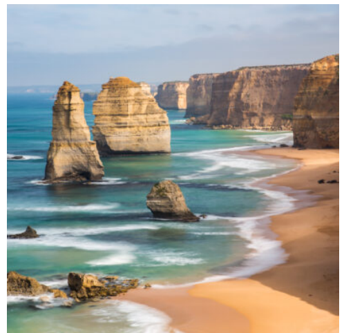
Great Ocean Road

Nach dem Frühstück übernehmen Sie Ihren Mietwagen und verlassen Melbourne in Richtung Süden. Ihr Ziel ist die malerische Mornington Peninsula – bekannt für sanfte Hügel, Weinregionen, Küstenorte und herrliche Strände. Erleben Sie bei einer geführten Tour durch Montalto das Beste jeder Jahreszeit – von Weinberg und Olivenhain bis hin zu Küchengärten und Skulpturenpark. Genießen Sie eine exklusive Weinverkostung mit Blick aufs Anwesen sowie ein 5-Gänge-Degustationsmenü im Restaurant, das die „Estate to Plate“-Philosophie kulinarisch erlebbar macht. (F A)