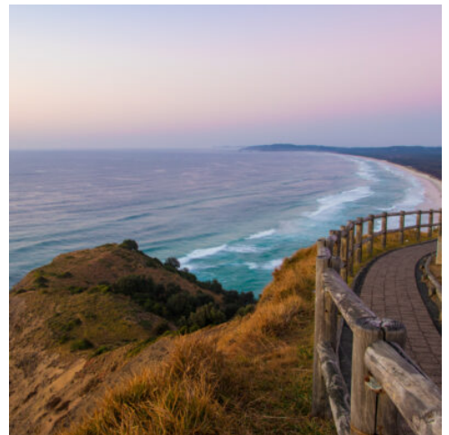
Gold Coast - Byron Bay

Entdecken Sie heute die schönsten Höhepunkte der multikulturellen Metropole am Meer. Am Mrs Macquarie's Chair im Botanischen Garten bekommen Sie eine wunderbare Aussicht auf das Opera House und auf die Harbour Bridge. Die bekannten Wahrzeichen der Stadt bieten tolle Fotomotive. Am berühmten Bondi Beach erleben Sie die strandgesäumte Seite Sydneys und können den Surfern beim akrobatischen Wellenreiten zuschauen. Mit einem Schiff geht es anschließend zu einer ausgiebigen Rundfahrt durch den riesigen Naturhafen. Den restlichen Tag können Sie die Stadt in Ihrem eigenen Tempo erkunden. Das Viertel The Rocks ist ein beliebtes Ausflugsziel. Zahlreiche Cafés, Bars und Galerien laden zum Verweilen ein. (F M)