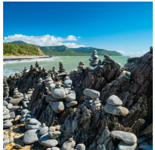
Balancing Rocks Of North Queensland

Was macht man im Paradies? Sich rundum wohl fühlen! Dafür haben wir gesorgt. Sie können spazieren gehen und den weichen Sand unter Ihren Füßen spüren, relaxen in beschaulicher Insellage oder bei einer geführten Allradtour (optionaler Ausflug) die einzigartige Naturlandschaft erkunden. Je nach Jahreszeit tauchen vor der Küste mächtige Wale auf. Mit einem Fernglas sind Sie dann bestens ausgerüstet. (F)