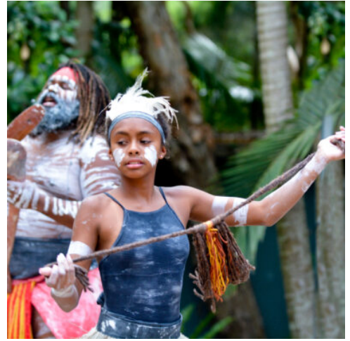
Australien - Aborigines

Heute erleben Sie die Wunder des Great Barrier Reefs. Nach einer Fahrt mit einem Ausflugsschiff, weit hinaus ins Outer Reef, verbringen Sie diesen Tag mit Schnorcheln, Tauchen (gegen Gebühr) und Schwimmen in der farbenfrohen Unterwasserwelt der Korallen und Fische. (F M)