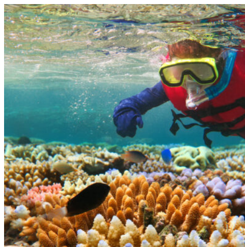
Great Barrier Reef

Heute verlassen Sie Daydream Island. Zurück auf dem Festland erwarten Sie ausgedehnte Zuckerrohrfelder auf der Fahrt nach Norden. Zwischendurch macht das Billabong Sanctuary Sie vertraut mit der endemischen Tierwelt Australiens. Seien Sie gefasst auf eine Tierbegegnung der besonderen Art. Tagesziel ist Townsville, die größte Stadt im nördlichen Queensland. (F A)