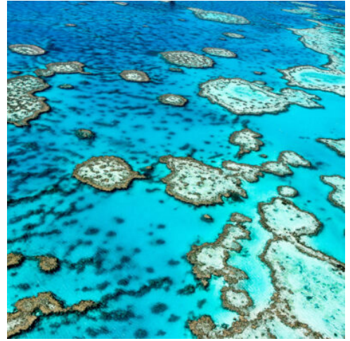
Great Barrier Reef

Der Noosa Nationalpark bietet spektakuläre Küstenwanderungen mit Blick auf dramatische Klippen und eine reiche Tierwelt, einschließlich Delfinen und Koalas. Die trendige Hastings Street lockt mit exklusiven Boutiquen, Cafés und Restaurants, während der Noosa River zum Kajakfahren und Bootfahren einlädt.