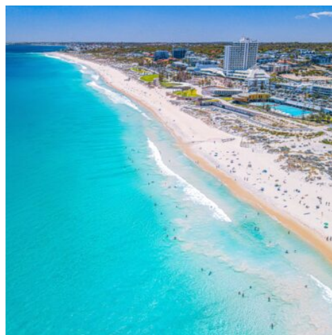
Scarborough Beach Perth

Am Morgen verlassen Sie El Questro und fahren zurück nach Kununurra. Dort erwartet Sie eine entspannte Bootsfahrt auf dem Ord River – inklusive Mittagessen am Ufer und faszinierenden Ausblicken auf die vielfältige Tierwelt und die unberührte Natur der Region. (F M)