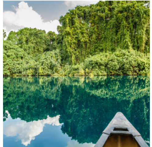
Blue Hole auf Espiritu Santo

Heute tauchen Sie in die ursprüngliche Kultur Tannas ein. Sie besuchen ein traditionelles Dorf im Inselinneren und erhalten Einblicke in eine Lebensweise, die sich seit Jahrhunderten kaum verändert hat. (F)