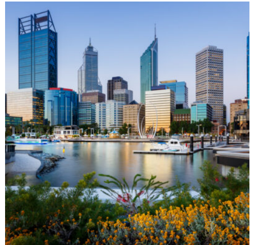
Elizabeth Quay Perth Western Australia Cityscape

In Singapur steigen Sie um in Ihren Flieger nach Perth, wo Sie am Nachmittag landen werden. Der Rest des Tages steht Ihnen zur freien Verfügung.