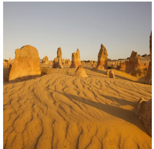
Pinnacles im Nambung Nationalpark

Heute Vormittag besuchen Sie per Kleinflugzeug die Gruppe der Wallabi-Inseln im Houtman-Abrolhos-Archipel. Hier strandete 1629 das niederländische Handelsschiff Batavia. Danach kam es zu einer blutigen Meuterei. Zurück auf dem Festland geht es via Küstenstraße über Port Gregory in den Kalbarri Nationalpark. Die schroffen Küstenformationen sind von beeindruckender Schönheit. Gegen Abend treffen Sie im verträumten Kalbarri ein. (F)