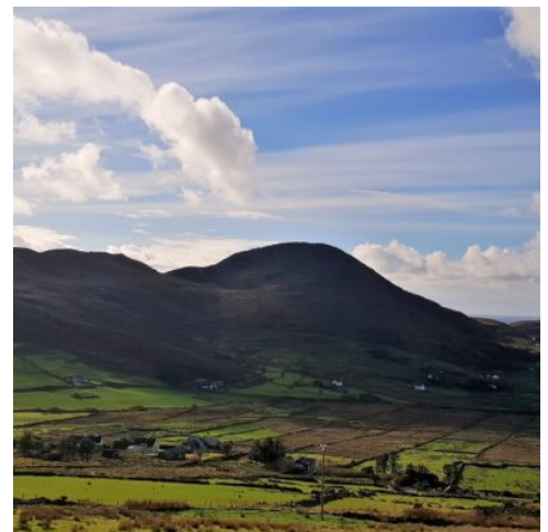
Ring of Kerry