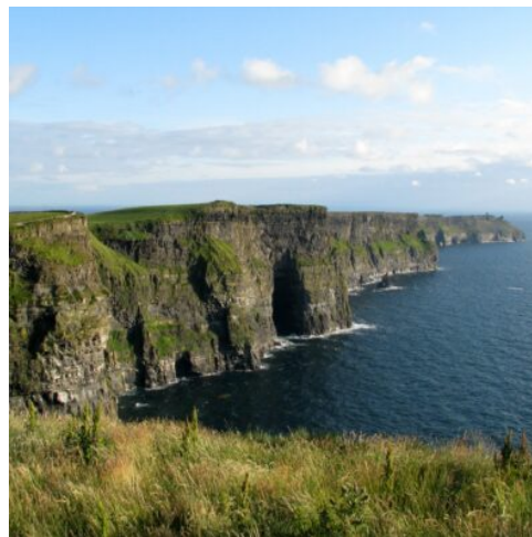
Klippen von Moher

Direkter Transfer zum Flughafen Dublin und Heimreise. (F)