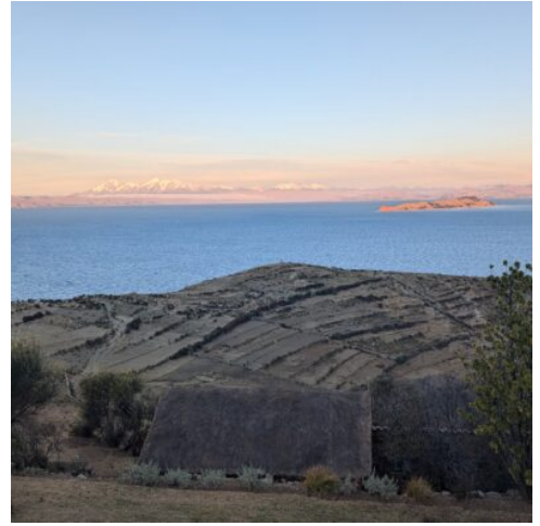
Sonnenuntergang auf der Sonneninsel

Heute brechen Sie zu einer ganztägigen Tour auf, die Sie in den faszinierenden Salar de Uyuni führt. Zunächst machen Sie einen Halt am Zugfriedhof, wo die Überreste von Dampflokomotiven aus dem 19. und 20. Jahrhundert einen eindrucksvollen Blick auf die Geschichte der Region bieten. Weiter geht es nach Colchani, dem idealen Ort, um mehr über die traditionelle Salzproduktion zu erfahren. Hier haben Sie die Gelegenheit, den gesamten Produktionsprozess zu beobachten und mehr über die Bedeutung des Salzes für die Region zu lernen. Ein weiteres Highlight der Tour ist die Isla Incahuasi. Diese Insel, eine grüne Oase inmitten der Salzwüste, ist bekannt für ihre riesigen Kakteen, die bis zu 10 Meter hoch wachsen. Im Anschluss fahren Sie weiter nach Norden zu den Chullpares, antiken Gräbern nahe dem Tunupa-Vulkan, die von den ursprünglichen Andenkulturen zeugen. (F M A)