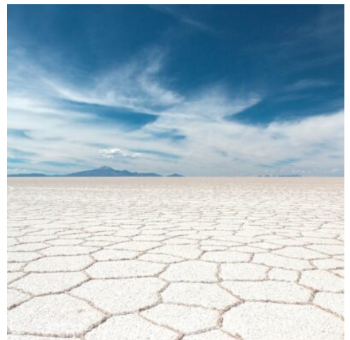
Salar de Uyuni

Am heutigen Tag tauchen Sie in die Geschichte Sucres ein. Die erste Station ist die Casa de la Libertad, das „Haus der Freiheit“, wo 1825 die Unabhängigkeitserklärung Boliviens unterzeichnet wurde. Dieses historische Gebäude gibt faszinierende Einblicke in die Erhebung Boliviens zur unabhängigen Nation. Im Anschluss besuchen Sie den Parque Bolívar, der für seine Nachbildungen des Eiffelturms und des Triumphbogens bekannt ist und einen Hauch europäischer Aristokratie inmitten der bolivianischen Hauptstadt vermittelt. Weiter geht es zur Kirche und dem Museum La Recoleta, einem bedeutenden kolonialen Bauwerk, und schließlich entdecken Sie das ASUR-Museum, das die textile Kunst der Ureinwohner Boliviens präsentiert. (F M)