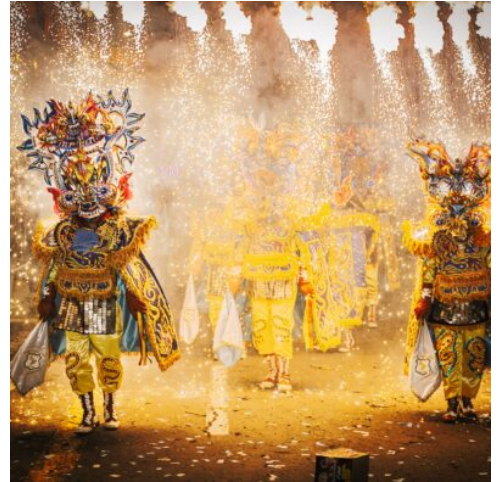
Karneval in Oruro

kennenzulernen. Schutzkleidung und Helme werden gestellt, sodass Sie sicher in die Geschichte der einst reichsten Silberminen der Welt eintauchen können. Am Nachmittag geht es zurück zur Hacienda Cayara , um den Rest des Tages in diesem wunderschönen Museumshotel zu genießen. (F M A)