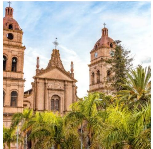
Kathedrale San Lorenzo in Santa Cruz

Nach dem Frühstück geht es zum Flughafen für den Flug nach Sucre. Dort tauchen Sie in die Geschichte Sucres ein. Die erste Station ist die Casa de la Libertad, das „Haus der Freiheit“, wo 1825 die Unabhängigkeitserklärung Boliviens unterzeichnet wurde. Dieses historische Gebäude gibt faszinierende Einblicke in die Erhebung Boliviens zur unabhängigen Nation. Im Anschluss besuchen Sie den Parque Bolívar, der für seine Nachbildungen des Eiffelturms und des Triumphbogens bekannt ist und einen Hauch europäischer Aristokratie inmitten der bolivianischen Hauptstadt vermittelt. Weiter geht es zur Kirche und dem Museum La Recoleta, einem bedeutenden kolonialen Bauwerk, und schließlich entdecken Sie das ASUR-Museum, das die textile Kunst der Ureinwohner Boliviens präsentiert. (F)