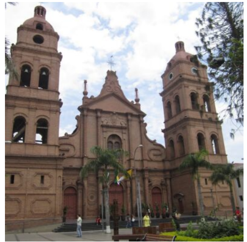
Santa Cruz de la Sierra

Nach dem Frühstück geht es zum Flughafen für den Flug nach Sucre. Dort tauchen Sie in die Geschichte Sucres ein. Die erste Station ist die Casa de la Libertad, das „Haus der Freiheit“, wo 1825 die Unabhängigkeitserklärung Boliviens unterzeichnet wurde. Dieses historische Gebäude gibt faszinierende Einblicke in die Erhebung Boliviens zur unabhängigen Nation. Im Anschluss besuchen Sie den Parque Bolívar, der für seine Nachbildungen des Eiffelturms und des Triumphbogens bekannt ist und einen Hauch europäischer Aristokratie inmitten der bolivianischen Hauptstadt vermittelt. Weiter geht es zur Kirche und dem Museum La Recoleta, einem bedeutenden kolonialen Bauwerk, und schließlich entdecken Sie das ASUR-Museum, das die textile Kunst der Ureinwohner Boliviens präsentiert. (F)