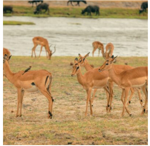
Antilopen im Moremi Wildreservat

Erleben Sie heute das Okavango Delta auf eine ganz besondere Art und Weise: mit einer Fahrt im Mokoro, einem traditionellen Einbaum, der sanft die schilfgesäumten Kanäle des Deltas durchzieht. Lehnen Sie sich zurück und genießen Sie die absolute Ruhe, während das Wasser sanft unter dem Mokoro plätschert. Ihr erfahrener „Poler“ (Steuermann) lenkt das Boot mit Präzision und Wissen durch das Delta und macht Sie auf die faszinierende Fauna und Flora aufmerksam. Nach dieser ruhigen und eindrucksvollen Erfahrung kehren Sie zum Mittagessen in Ihre Lodge zurück, wo Sie sich bei einem erfrischenden Drink entspannen können. Am Nachmittag haben Sie die Wahl, Ihre Safari mit einer aufregenden Pirschfahrt im offenen Geländewagen fortzusetzen oder das Delta aus einer anderen Perspektive bei einer Bootssafari zu erleben. Den Tag lassen Sie mit einem traditionellen „Sundowner“ ausklingen. Einem erfrischenden Drink inmitten der Wildnis, während die Sonne langsam über den Horizont sinkt und der afrikanische Abend einsetzt. (F M A)