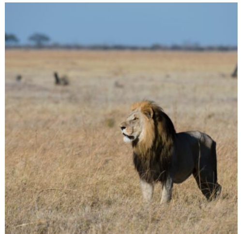
Löwe im Savuti-Gebiet

Heute erwartet Sie ein aufregendes Abenteuer im Moremi Wildreservat, einem der renommiertesten und tierreichsten Gebiete im Okavango Delta. Auf einer ganztägigen Pirschfahrt im offenen Geländewagen tauchen Sie tief in die afrikanische Wildnis ein und haben die Chance auf fantastische Tierbeobachtungen und unvergessliche Erlebnisse. Früher war das Moremi Wildreservat das reichste Jagdgebiet des Batswana-Stammes, bevor es zum Schutzgebiet erklärt wurde und heute als eines der besten Gebiete für Wildtierbeobachtungen gilt. Während der Pirschfahrt erkunden Sie die vielfältige Flora und Fauna des Parks: Elefanten, die majestätisch durch die Wälder ziehen, Flusspferde und Büffel, die sich in den Gewässern tummeln, sowie Löwen, die die weite Savanne durchstreifen. Mit etwas Glück begegnen Sie auf der Safari auch seltenen Raubtieren bei der Jagd oder entdecken andere faszinierende Tiere, die in dieser unberührten Wildnis ihren Lebensraum finden. (F M A)