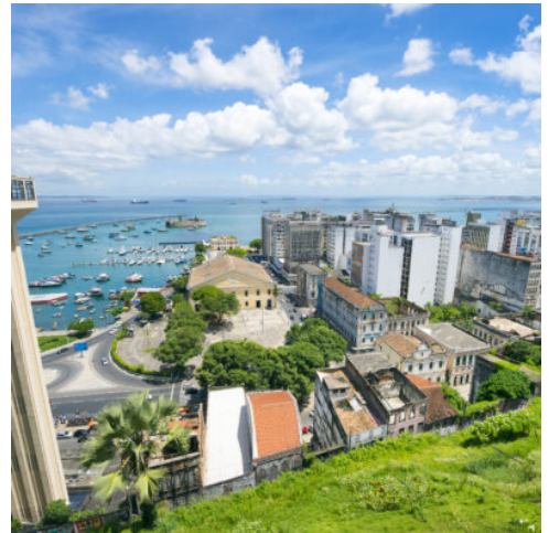
Salvador da Bahia

Frühmorgens geht es vom Hotel aus zum Hafen. Den Amazonas-Regenwald in seiner ganzen Tiefe kennenzulernen, das ist es, was diese Reise so besonders macht. Drei Tage zum Genießen und Kennenlernen der Magie dieses Ortes, umgeben von wunderschönen Naturlandschaften. Auf dem Weg geht es vorbei am berühmten Treffpunkt der Flüsse Solimões und Negro. Nach der Ankunft in der Lodge wird Ihnen ein Mittagessen serviert und eine Ruhepause eingeplant, bevor am Nachmittag die Region mit dem motorisierten Kanu erkundet wird. Das Abendessen erwartet Sie auf der Rückfahrt. Ein weiterer Abendausflug zur Sichtung von Alligatoren und Beobachtung der nächtlichen Fauna runden den Tag ab. (F M A)