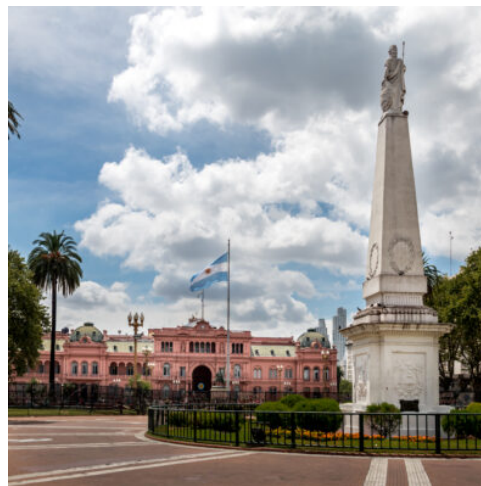
Plaza de Mayo in Buenos Aires

Der argentinische Sektor liegt im Nationalpark Iguazú und überrascht uns mit seiner reinen Natur und üppigen Vegetation. Seit 1984 sind die Fälle Teil des Weltnaturerbes und gehören auch zu den Sieben Naturwundern der Welt. Sie beginnen Ihren Besuch mit einer 20-minütigen Fahrt mit dem ökologischen Zug zur Station Garganta del Diablo (Teufelsrachen). Von dort aus führt ein System von Stegen zum berühmten und imposanten Taufelsrachen. Flug nach Buenos Aires. (F A)