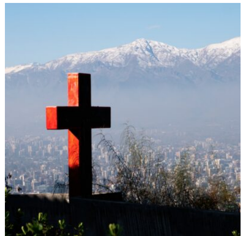
Blick von Cerro San Cristóbal über Santiago de Chile

Morgens fahren Sie nach Santiago de Chile und entdecken tagsüber die chilenische Hauptstadt – eine Stadt der Kontraste mit schönen Bauten im kolonialen Stil sowie modernen Hochhäusern, die Sie auch vom Aussichtspunkt Cerro San Cristóbal bewundern können. Sie besuchen das historische Stadtzentrum und die modernen Stadtteile Providencia und Las Condes. Anschließend werden Sie zu einem Hotel am Flughafen gebracht, da Sie am nächsten morgen früh weiterreisen. (F M)