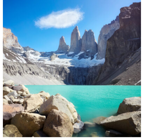
Torres del Paine Nationalpark

Nach dem Frühstück Fahrt durch die chilenische Steppe von Punta Arenas auf dem südchilenischen Festland an der Magellanstraße nach Norden in Richtung des Torres del Paine Nationalparks. Sie übernachten heute in Puerto Natales, einem Städtchen, das wunderschön an einem Meeresarm umgeben von Fjorden und Gletschern liegt und für viele Besucher als Basisstation für einen Besuch des berühmten Torres del Paine Nationalparks dient. (F A)