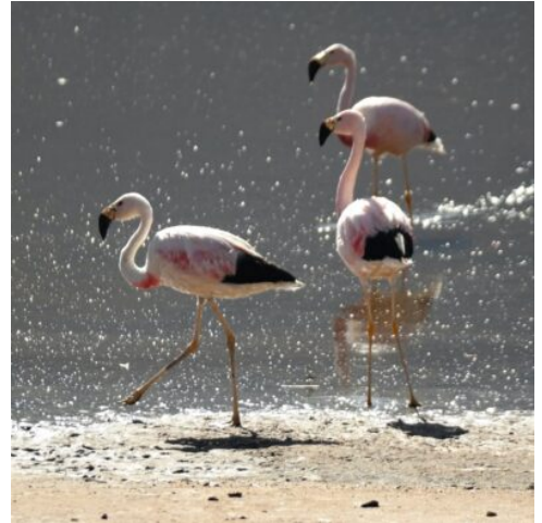
Flamingos in der Laguna Chaxa im Norden Chiles

Nach dem Frühstück fahren Sie zuerst in das Dörfchen Tonocao, wo eine historische Kirche mit einem imposanten weißen Glockenturm und einer reich verzierten Tür aus Kaktusholz begeistert. Ihr nächstes Ziel sind die atemberaubenden Altiplano-Lagunen am Fuße der Vulkane Miscanti (4.140 m) und Miñiques (4.120 m). Unzählige Flamingos nisten am Ufer der glasklaren Lagunen, die im Zusammenspiel mit den mächtigen Vulkanen ein eindrucksvolles Landschaftspanorama erschaffen. Der Höhepunkt Ihres heutigen Ausfluges erwartet Sie mit der ewigen Salar de Atacama, ein gewaltiger Salzsee, der sich bis an den Horizont erstreckt und zahlreichen Flamingo-Arten ein Zuhause bietet. Einsame Salzebenen erstrecken sich bis hin zu den Vulkanen am Horizont, während sie an der Laguna Chaxa die verschiedensten Vogelarten in freier Wildbahn beobachten. Mit zahlreichen neuen Impressionen im Gepäck kehren Sie nach San Pedro zurück. (F)