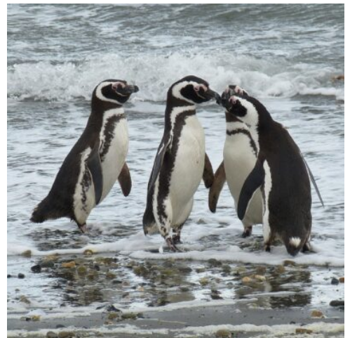
Magellanpinguinen in Patagonien

Durch die patagonische Steppe folgen Sie heute dem malerischen Última-Esperanza-Fjord nach Puerto Natales, Tor zum Nationalpark Torres del Paine. Drei mächtige Granitnadeln bilden das Wahrzeichen dieser rauen Welt, die Sie in den nächsten Tagen entdecken werden. Hoch aufragende Berge prägen den Nationalpark, eisige Gletscher erschaffen eine einzigartige Welt aus Schnee, von der sich immer wieder mächtige Eisberge abspalten. Herden der kamelartigen Guanakos streifen durch die Steppen, türkisblaue Seen und mächtige Felsmassive erschaffen traumhafte Landschaften, die Sie zum Staunen bringen werden. (F)