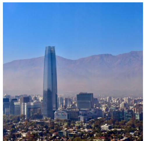
Santiago de Chile

Nach Ihren Entdeckungen in Valparaíso fahren Sie heute zurück nach Santiago de Chile, um die chilenische Hauptstadt zu entdecken. Idyllisch in einem Tal gelegen und von Bergen umringt, begeistert Santiago als moderne Stadt mit einer langen Geschichte. Beginnen Sie Ihre Stadtrundfahrt auf dem Plaza de Armas, das historische Herz und noch immer kulturelles Zentrum der Stadt, das mit prächtigen Kolonialbauten und palmengesäumten Straßen bezaubert. Die modernen Stadtteile Providencia und Las Condes präsentieren sich mit grünen Parks, zahlreichen Einkaufsmöglichkeiten und einem hochmodernen Finanzviertel, das in Anlehnung an den New Yorker Stadtteil Manhattan den Beinamen Sanhattan trägt. Mit der Seilbahn erobern Sie einen der schönsten Aussichtspunkte der Stadt, der stadtbildprägende Hügel Cerro San Cristóbal, von dem aus sich ein wundervoller Panoramablick auf Santiago bietet. (F)