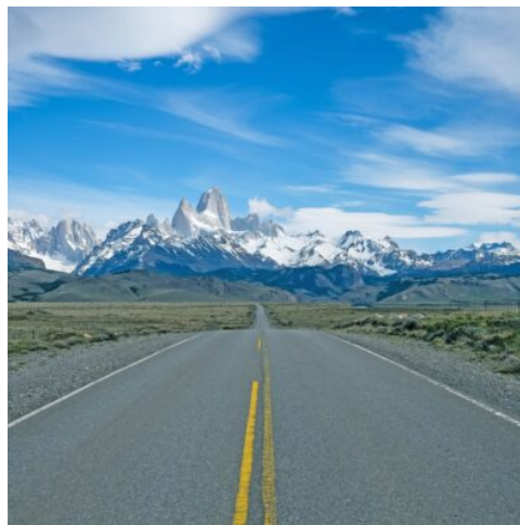
Der Weg nach Torres del Paine

Aus dem Süden fliegen Sie heute zurück nach Santiago de Chile. Nutzen Sie den Rest des Tages doch für einen Spaziergang in Eigenregie durch die lebhafteste Stadt. (F)