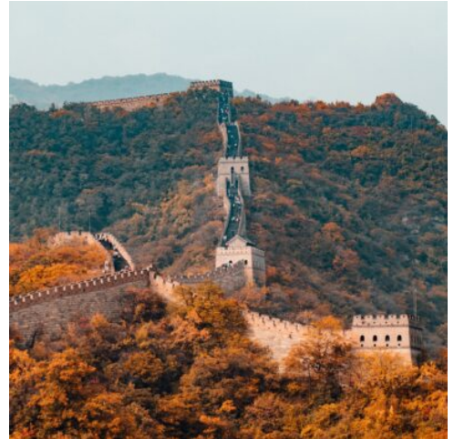
Die Chinesische Mauer

Herzlich willkommen in Peking. Bei Ihrer Landung werden Sie bereits von Ihrer Reiseleitung erwartet und zu Ihrem Hotel gefahren. Peking, auch bekannt als Beijing, blickt auf eine 3.000 Jahre währende Geschichte zurück, die sich in zahlreichen Sehenswürdigkeiten spiegelt. Der Rest des Tages steht Ihnen zur freien Verfügung. Nutzen Sie die Zeit doch für einen ersten Spaziergang auf eigene Faust durch die Stadt oder erholen Sie sich von Ihrer Anreise. Am Abend genießen Sie Sie bei einem Willkommensdinner die berühmte Pekingente. (A)