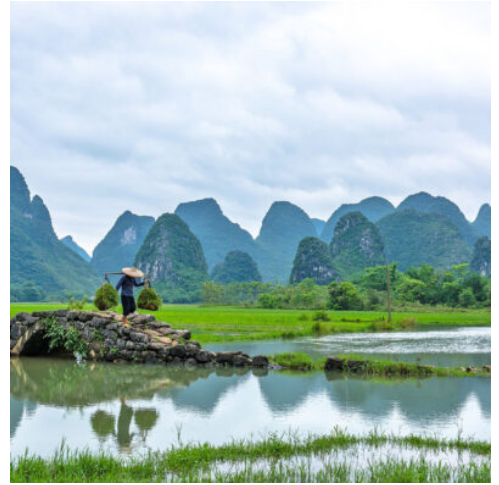
Die Landschaft um Guilin

Die Altstadt von Shanghai entführt Sie bei einem Rundgang in die lange Vergangenheit der Metropole. Als erstes erreichen Sie den Yu-Garten, eine Oase der Ruhe inmitten der quirligen Stadt und einer der schönsten chinesischen Gärten der Welt. Verwinkelte Gassen mit traditionellen Teehäusern und Handwerksbetrieben führen Sie bis zur berühmten Uferpromenade „Bund“. Auch als Asiens „Wallstreet“ bekannt, begeistert die Promenade mit imposanten Gebäuden aus den 30er Jahren und einem fantastischen Blick auf den Fluss Huangpu. Unvergesslich ist ein Besuch der Einkaufsmeile Nanjing Road, die mit unzähligen Geschäften und Boutiquen, Leuchtreklamen und Restaurants lockt. Zum krönenden Abschluss erwartet Sie an diesem Abend eine Hafentrundfahrt, in der Sie die abendliche Metropole aus einer ganz besonderen Perspektive entdecken. (F A)