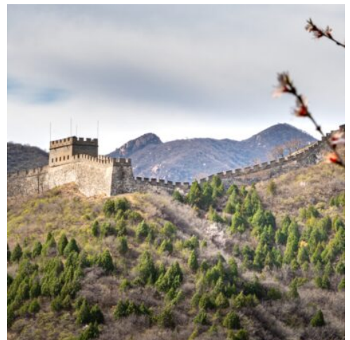
Chinesische Mauer am Juyongguan Pass

Heute unternehmen Sie einen Ausflug zur beeindruckenden Juyongguan, einem der bekanntesten und am besten erhaltenen Abschnitte der Große Mauer. Anschließend besuchen Sie den weitläufigen Sommerpalast mit seinen prachtvollen Gartenanlagen, Pavillons und dem malerischen Kunming-See. Auf dem Rückweg legen Sie einen Fotostopp am markanten Nationalstadion Peking („Vogelnest“) ein, das als Wahrzeichen der Olympischen Spiele 2008 gilt. Am Abend erfolgt die Fahrt mit dem Nachtzug nach Xi'an. Sie übernachten in einem 4-Bett-Abteil der 1. Klasse und erleben eine authentische Reise durch das Reich der Mitte. (F)