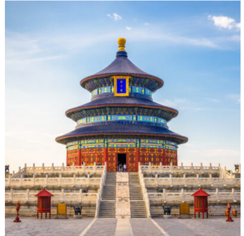
Himmelstempel in Peking

Nach der Ankunft in Peking steht Ihnen der Rest des Tages zur freien Verfügung (Flughafentransfers siehe Wunschleistungen).