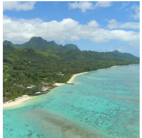
Rarotonga aus der Luft

Die Insel Rarotonga bietet zahlreiche Möglichkeiten: ob ein ausgiebiger Strandspaziergang, Schnorcheln, eine Lagunen Tour oder eine Wanderung durch das Inselinnere. Lassen Sie sich verzaubern von der Schönheit und Freundlichkeit dieses Juwels. (F)