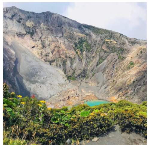
Der Irazú Vulkan und Nationalpark, Costa Rica

Der Tag beginnt heute mit einer einfachen Wanderung im Umland der Lodge, um die schillernden Quetzal-Vögel mit ihren langen Schwanzfedern zu beobachten. Die farbenfrohen Quetzale – in der Maya-Kultur als Göttervögel verehrt – leben in den umliegenden Aguacatillo-Bäumen und lassen sich mit etwas Glück während des geführten Rundgangs beobachten. Danach erkunden Sie den umliegenden tropischen Gebirgswald. Bromelien, Farne, Orchideen, Moose – eine ganzjährige, zauberhafte Blütenpracht – und exotische Vogelarten machen das Tal zu einem der attraktivsten Orte des Landes. (F)