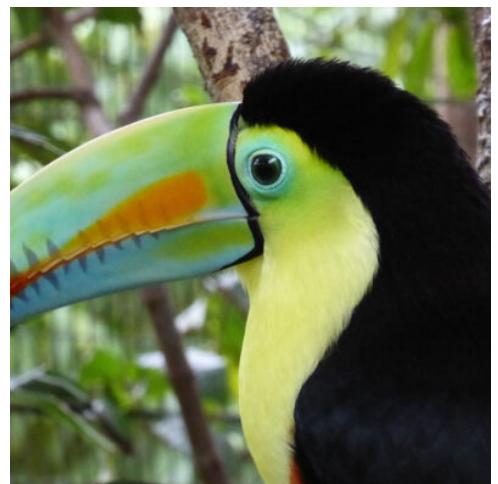
Tukan im Regenwald

Am Morgen unternehmen Sie eine Strandwanderung im Bahia Ballena Nationalpark und entdecken dabei die Schönheit dieses Schutzgebietes an Land. Danach steht der Tag zur freien Verfügung. Entspannen Sie beim Baden im Hotel oder buchen Sie optional vor Ort einen Bootsausflug im Ballena-Meerresnationalpark. Diese interessanten Erkundungsfahrten im maritimen Bereich des Schutzgebiets dienen zur Beobachtung von Walen und Delfinen. In dieser Region leben fünf verschiedene Arten von Walen und mit etwas Glück kommen die Delfine nahe an die Boote heran und erlauben so außergewöhnliche Schnappschüsse mit der Kamera. (F)