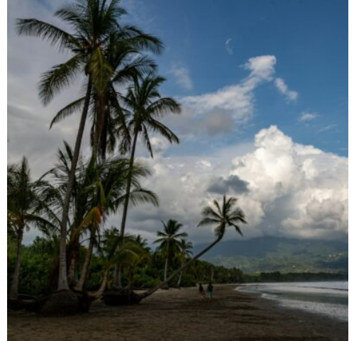
Bahia Ballena Nationalpark

Im Nebelwald rund um Monteverde erwartet Sie heute ein Abenteuer der ganz besonderen Art: Eine Wanderung im Selvatura-Park über und zwischen den Baumwipfeln des Nebelwaldes. Auf einem System von aufeinander folgenden, stabilen Hängebrücken aus Metall gewinnen Sie einen Einblick in das empfindliche Ökosystem der artenreichen Baumkronen. Der lokale Führer erklärt die Vielzahl des unvergleichlichen Artenreichtums an Fauna und Flora im Lebensraum Nebelwald. Optional können Sie am Ende der Wanderung über die Hängebrücken noch eine Canopy-Tour unternehmen. Dabei gleiten Sie gesichert über eine Stahlseilrutsche durch den dichten Wald und sehen ihn so aus einer ganz neuen Perspektive. (F)