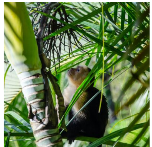
Kapuzineraffe im Palme