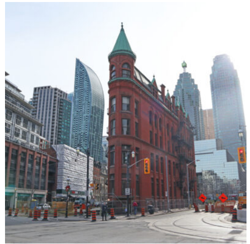
Toronto - Gooderham Building

Sie beginnen den Tag mit einem Spaziergang entlang der Promenade vom Table Rock bis zur Anlegestelle des ‚Hornblower-Schiffs‘, um den spektakulären Blick auf die Wasserfälle zu genießen. Während einer Bootsfahrt zu den Füßen der Niagarafälle erleben Sie aus nächster Nähe die unheimliche Kraft der mit Donnern und Getöse fallenden Wassermassen. Weiterfahrt entlang des prächtigen Niagara-Parkways in Richtung Niagara-on-the-Lake. Die Kleinstadt an der Mündung des Niagara-Flusses erinnert mit ihrem viktorianischen Baustil und einer Nachbildung des Big Ben auch heute noch an England. Sie besuchen anschließend Fort George – eine historische Festungsanlage mit strategischer Bedeutung – sowie ein Weingut, wo Sie den berühmten Eiswein kosten dürfen. (F)