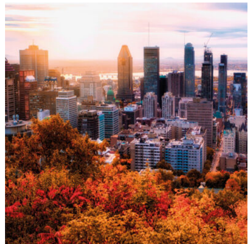
Montreal - Sonnenaufgang mit bunten Blätter

Am Vormittag besuchen Sie das imposante Besucherzentrum des Algonquin Parks mit dem nebenan liegenden Logging Museum, das Ihnen während einen leichten Spaziergang einen Einblick in die Geschichte der Kanadische Holzindustrie bietet. Im Laufe des Nachmittags kommen Sie in Ottawa an. Die Regierungshauptstadt Kanadas besticht durch ihre gemütliche, britisch angehauchte Atmosphäre. Während eine Stadtrundfahrt durch Ottawa sehen Sie u.a. das Parmenthügel, die viele Gedenkstätte, Sussex Drive und Rideau Hall, mehreren Botschaften, die National Gallery und das Rideau Kanal. Anschließend haben Sie etwas Freizeit am Byward Markt, bevor es weiter ins Hotel in die Nachbarstadt Gatineau auf der anderen Seite des Ottawa Flusses geht. (F)