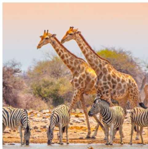
Etosha Nationalpark, Namibia

Heute heißt es Abschied nehmen von Ihrem Abenteuer in Namibia. Sie werden zum Flughafen Windhoek gefahren und treten Ihren Rückflug nach Deutschland an.