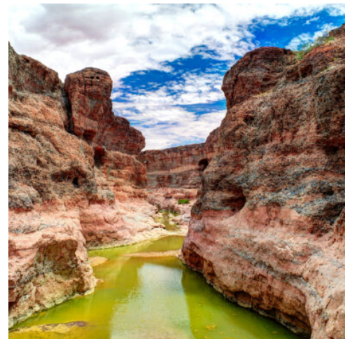
Sesriem Canyon, Namibia

Zahlreiche Abenteuer locken heute zu neuen Entdeckungen. Beginnen Sie Ihren Tag mit einem Besuch von Twyfelfontein. Über 2.500 Felsgravuren und Malereien zeichnen die roten Felsen, die sich in faszinierenden Formationen aus dem Tal erheben. Seine enorme historische Bedeutung machte diesen Ort zu einem der wichtigsten Kulturzentren der Welt, der 2007 in die Liste der UNESCO-Weltkulturerbes aufgenommen wurde. In einem traditionellen Dorf eröffnet sich Ihnen anschließend ein faszinierender Einblick in die Kultur der Damara. Ein weiteres Highlight der Region bildet der Versteinerte Wald. 260 Millionen Jahre reicht die Geschichte der Baumstämme zurück, die unberührt von Sand und Wind bis heute ihre ursprüngliche Form beibehalten haben. Streifen Sie zwischen den unbeugsamen Stämmen hindurch und entdecken Sie zwischen den Bäumen die Welwitschia, die älteste Wüstenpflanze der Welt. (F A)