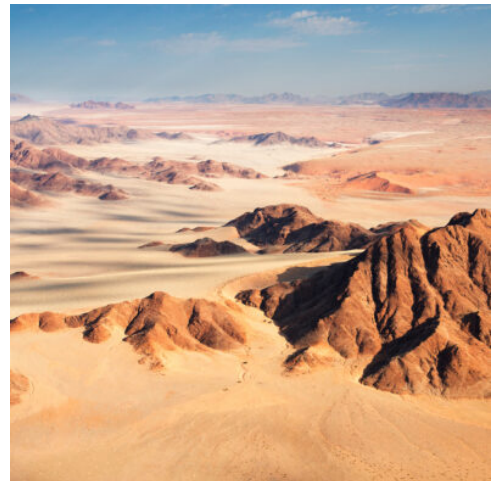
Namib Wüste, Namibia

Im Schein der Morgendämmerung lockt das erste Erlebnis des Tages. Im Namib Naukluft Park erheben sich gewaltige Dünen in bis zu 300 m Höhe, ein einzigartiger Anblick, der die Fahrt durch die Wüste zu einem unvergesslichen Erlebnis macht. Mit einem Allradfahrzeug gelangen Sie noch tiefer in die ursprüngliche Wüstenwelt, tief hinein in die unwirtliche Salztongpfanne des Sossusvlei. Tiefe Ruhe erfüllt die karge Landschaft, aus der sich rot die höchsten Dünen der Welt erheben. Nicht weit von hier erwartet Sie der Sesriem Canyon, eine dreißig Meter tiefe Schlucht, deren gewaltige Felswände nur ein schmaler Gang trennt, durch den einst ein Fluss führte. Lassen Sie sich auf dem Rückweg zur Lodge noch einmal von den faszinierenden Panoramen der Namib verzaubern. (F A)