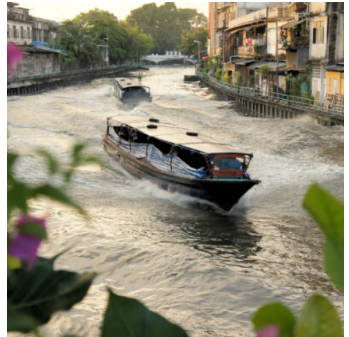
Klongs in Bangkok

Heute treten Sie Ihren Flug in den bergigen Norden in die historische Stadt Chiang Mai an, die den Beinamen „Rose des Nordens“ trägt. Eine nachmittägliche Tour entführt Sie in die malerische Altstadt, die mit ihrer schönen historischen Architektur bezaubert und mit über 200 Tempeln zugleich einen einzigartigen Einblick in die altherwürdige Tradition des Buddhismus gewährt. Nach dem quirligen Treiben der Stadt lockt der friedliche Tempel Wat Pha Lat inmitten des Regenwaldes mit idyllischer Ruhe. Entspannen Sie an diesem paradiesischen Fleckchen Erde und lauschen Sie dem Plätschern des nahen Wasserfalls, bevor Sie Ihre Reise zum Wahrzeichen Chiang Mails fortsetzen – dem Wat Phrathat Doi Suthep. Reich verzierte Schlangenstatuen flankieren den Weg zum prachtvollen Tempel, der in strahlendem Gold mit kunstvollen Verzierungen bezaubert. Genießen Sie den atemberaubenden Blick über Chiang Mai und wie die untergehende Sonne die Dächer der Stadt in rotes Licht taucht, während der Abendgesang der Mönche zum Träumen einlädt. (F A)