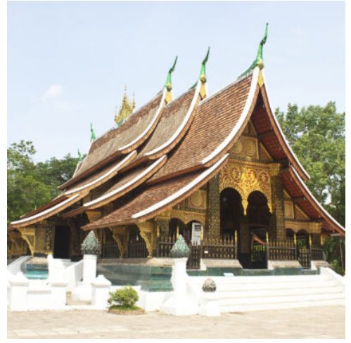
Wat Xiengthong in Luang Prabang, Laos

Nach den urbanen Erlebnissen des letzten Tages tauchen Sie heute in die wunderbare Natur von Laos ein. Inmitten des ursprünglichen Regenwaldes liegen die mächtigen Kuang Xi-Wasserfälle. Rauschend stürzen sich die Wassermassen in die natürlichen Kalksteinbecken, in denen sich das türkisblau schimmernde Wasser sammelt und zu einem erfrischenden Bad einlädt. Genießen Sie die ursprüngliche Umgebung, die Sie mit wilden Farnen und tropischen Pflanzen zu einem erholsamen Spaziergang einlädt. Erholen Sie sich im Schatten der mächtigen Bäume und beobachten Sie, wie Schmetterlinge und exotische Vögel durch die Lüfte gleiten und Affen im Geäst Fangen spielen, ehe Sie nach Luang Prabang zurückkehren. (F M)