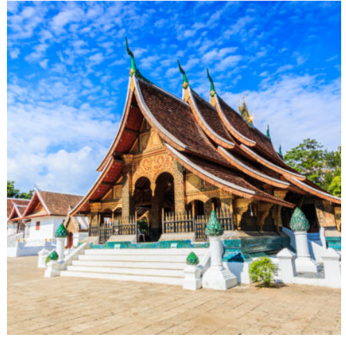
Wat Xieng Thong in Luang Prabang

Nach den urbanen Erlebnissen des letzten Tages tauchen Sie heute in die wunderbare Natur von Laos ein. Inmitten des ursprünglichen Regenwaldes liegen die mächtigen Kuang Xi-Wasserfälle. Rauschend stürzen sich die Wassermassen in die natürlichen Kalksteinbecken, in denen sich das türkisblau schimmernde Wasser sammelt und zu einem erfrischenden Bad einlädt. Genießen Sie die ursprüngliche Umgebung, die Sie mit wilden Farnen und tropischen Pflanzen zu einem erholsamen Spaziergang einlädt. Erholen Sie sich im Schatten der mächtigen Bäume und beobachten Sie, wie Schmetterlinge und exotische Vögel durch die Lüfte gleiten und Affen im Geäst Fangen spielen, ehe Sie nach Luang Prabang zurückkehren. (F M)