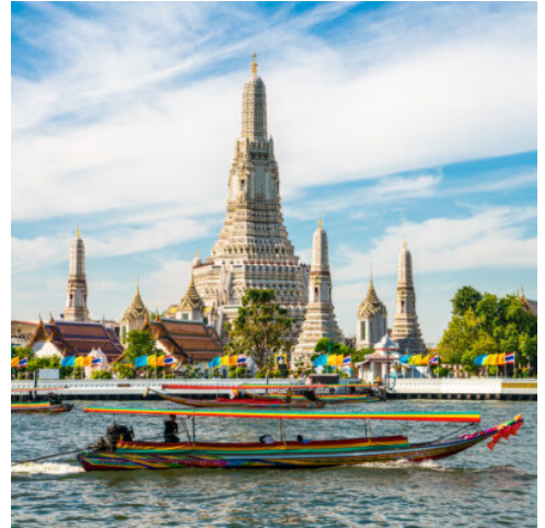
Wat Arun in Bangkok

Heute treten Sie Ihren Flug in den bergigen Norden in die historische Stadt Chiang Mai an, die den Beinamen „Rose des Nordens“ trägt. Eine nachmittägliche Tour entführt Sie in die malerische Altstadt, die mit ihrer schönen historischen Architektur bezaubert und mit über 200 Tempeln zugleich einen einzigartigen Einblick in die altherwürdige Tradition des Buddhismus gewährt. Nach dem quirligen Treiben der Stadt lockt der friedliche Tempel Wat Pha Lat inmitten des Regenwaldes mit idyllischer Ruhe. Entspannen Sie an diesem paradiesischen Fleckchen Erde und lauschen Sie dem Plätschern des nahen Wasserfalls, bevor Sie Ihre Reise zum Wahrzeichen Chiang Mails fortsetzen – dem Wat Phrathat Doi Suthep. Reich verzierte Schlangenstatuen flankieren den Weg zum prachtvollen Tempel, der in strahlendem Gold mit kunstvollen Verzierungen bezaubert. Genießen Sie den atemberaubenden Blick über Chiang Mai und wie die untergehende Sonne die Dächer der Stadt in rotes Licht taucht, während der Abendgesang der Mönche zum Träumen einlädt. (F A)