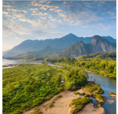
Mekong Landschaft in der Nähe von Pak Ou in Luang Prabang, Laos

Goldener Morgennebel gleitet über die Fluten des Mekong und erschafft ein einzigartiges Panorama, das Sie sich nicht entgehen lassen sollten. Beobachten Sie, wie die Natur zum Leben erwacht, während der Lauf des Flusses lebhafter wird und die Ufer näher rücken. Tauchen Sie im verschlafenen Dorf Ban Baw in das Alltagsleben der Menschen am Fluss ein. Folgen Sie dem atemberaubenden Mekong weiter zu einem der wichtigsten Heiligtümer des Landes: den berühmten Pak Ou-Höhlen, verborgen in einer steilen Felswand, die sich hoch über den Mekong erhebt. Im Laufe der Jahrtausende hinterließen hunderte Pilger unzählige kleine und große Buddhastatuen an diesem Ort, die einen einzigartigen Einblick in die tiefe spirituelle Tradition des Landes gewähren. Lassen Sie sich auf der Weiterfahrt von der malerischen Uferlandschaft aus sanften Hügeln und ursprünglichem Regenwald verzaubern, bevor Sie die atemberaubende Tempelstadt Luang Prabang und das Ende Ihrer Mekong-Flussreise erreichen. (F M)