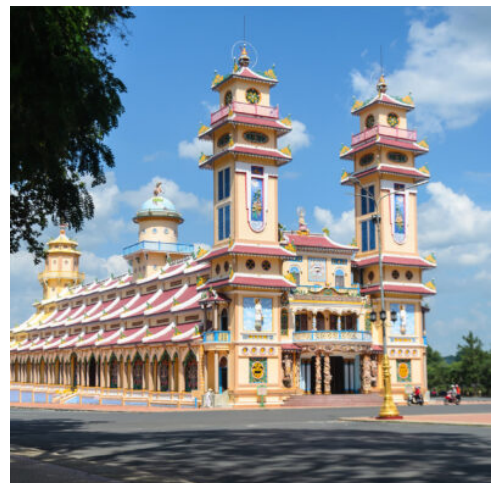
Cao Dai Tempel in Saigon, Vietnam

Bei Sonnenaufgang werden Sie von Ihrem Hotel abgeholt und zum Flughafen gebracht. Aus dem Herzen Südostasiens fliegen Sie in den Süden Vietnams, wo Sie die pulsierende Metropole Saigon erwartet. Entdecken Sie die Stadt zwischen Moderne und Tradition bei einer Stadtrundfahrt in all ihren Facetten. Den Auftakt macht der prächtige Wiedervereinigungspalast, der an die bewegte jüngere Geschichte des Landes erinnert. Das Französische Viertel verzaubert im Anschluss mit seiner schönen französischen Kolonialarchitektur und lässt Sie mit dem Opernhaus, dem Rathaus und dem historischen Postamt in die Vergangenheit eintauchen. Vertiefen Sie Ihr Wissen im War Remnants Museum, das einen eindrucksvollen Einblick in die Geschichte Vietnams bietet. (F A)