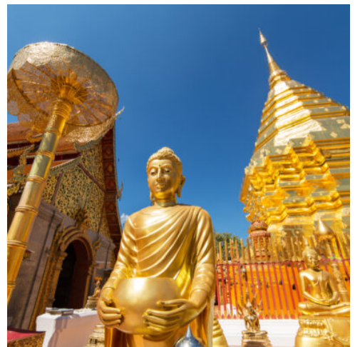
Wat Phrathat Doi Suthep

Unweit von Chiang Rai entfernt treffen die Grenzen von Thailand, Laos und Myanmar aufeinander und bilden das berühmte Goldenen Dreieck – Ihr heutiges Ziel. Einst beherrschte der Opiumhandel die atemberaubende Bergregion Doi Tung, die heute besonders durch ihre landschaftliche Schönheit besticht. Schlendern Sie durch die idyllischen Gartenanlagen von Mae Fah Luang, ehe Sie im prächtigen Tempel hoch auf dem Berg Doi Tung eine Reliquie Buddhas in die spirituelle Vergangenheit entführt. Nach einem Einblick in die thailändische Handwerkskunst und einem gemütlichen Mittagessen geht es weiter an die Grenze zu Myanmar nach Mae Sai, wo Sie in die farbenfrohe Welt des hiesigen Marktes eintauchen. Exotische Gerüche erfüllen die Luft, Händler bieten Stoffe, Früchte und Kunsthandwerkwerk feil. Am Ufer des Mekong erwarten Sie die prächtigen Ruinen von Chiang Saen, die an das alte Lanna-Königreich erinnern. Lassen Sie die faszinierende Atmosphäre auf sich wirken, während Sie zwischen den mächtigen Tempeln und Mauern umherwandern. Am Abend kehren Sie zurück nach Chiang Rai. (F M)