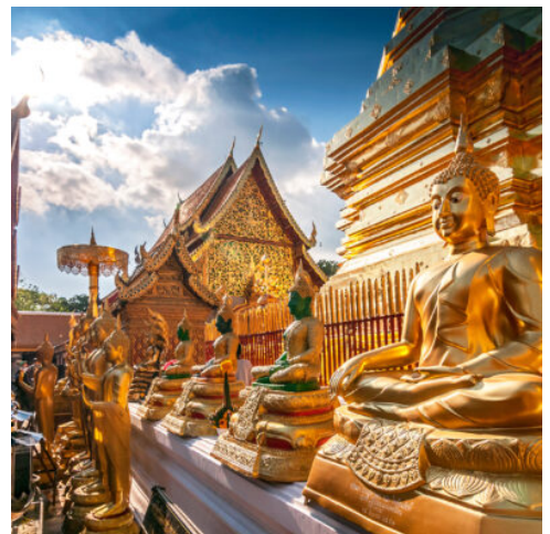
Goldene Buddhas in Wat Phrathat Doi Suthep in Chiang Mai, Thailand

Unweit von Chiang Rai entfernt treffen die Grenzen von Thailand, Laos und Myanmar aufeinander und bilden das berühmte Goldenen Dreieck – Ihr heutiges Ziel. Einst beherrschte der Opiumhandel die atemberaubende Bergregion Doi Tung, die heute besonders durch ihre landschaftliche Schönheit besticht. Schlendern Sie durch die idyllischen Gartenanlagen von Mae Fah Luang, ehe Sie im prächtigen Tempel hoch auf dem Berg Doi Tung eine Reliquie Buddhas in die spirituelle Vergangenheit entführt. Nach einem Einblick in die thailändische Handwerkskunst und einem gemütlichen Mittagessen geht es weiter an die Grenze zu Myanmar nach Mae Sai, wo Sie in die farbenfrohe Welt des hiesigen Marktes eintauchen. Exotische Gerüche erfüllen die Luft, Händler bieten Stoffe, Früchte und Kunsthandwerkwerk feil. Am Ufer des Mekong erwarten Sie die prächtigen Ruinen von Chiang Saen, die an das alte Lanna-Königreich erinnern. Lassen Sie die faszinierende Atmosphäre auf sich wirken, während Sie zwischen den mächtigen Tempeln und Mauern umherwandern. Am Abend kehren Sie zurück nach Chiang Rai. (F M)