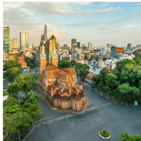
Skyline von Saigon, Vietnam

Früh am Morgen können Sie heute auf dem Markt von Vuon Chuoi in das echte Saigon eintauchen. Buntes Treiben herrscht zwischen den unzähligen Ständen, an denen Kleidung, Haushaltswaren, Schmuck und kulinarische Spezialitäten angeboten werden. Der exotische Duft fremder Gewürze liegt in der Luft und versüßt ihnen den Morgen. Schlendern Sie durch die umliegenden Gassen, suchen Sie sich ein kleines Café und beobachten Sie, wie die Metropole zum Leben erwacht. Tempel und Pagoden entführen Sie in die Traditionen des Buddhismus, moderne Einkaufszentren und schicke Boutiquen präsentieren das moderne Saigon. Genehmigen Sie sich im idyllischen Tao Dan Park ein wenig Ruhe, lauschen Sie dem Plätschern der zahlreichen Brunnen und genießen Sie den kühlenden Schatten der tropischen Bäume. Der Nachmittag steht Ihnen zur freien Verfügung. Erkunden Sie die Stadt auf eigene Faust, ehe Sie abends ein Abschiedsdinner in einem lokalen Restaurant erwartet. (F A)