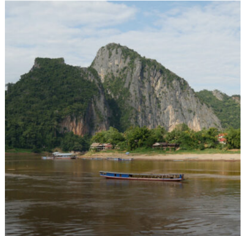
Mekong Landschaft in der Nähe von Pak Ou

Goldener Morgennebel gleitet über die Fluten des Mekong und erschafft ein einzigartiges Panorama, das Sie sich nicht entgehen lassen sollten. Beobachten Sie, wie die Natur zum Leben erwacht, während der Lauf des Flusses lebhafter wird und die Ufer näher rücken. Tauchen Sie im verschlafenen Dorf Ban Baw in das Alltagsleben der Menschen am Fluss ein. Folgen Sie dem atemberaubenden Mekong weiter zu einem der wichtigsten Heiligtümer des Landes: den berühmten Pak Ou-Höhlen, verborgen in einer steilen Felswand, die sich hoch über den Mekong erhebt. Im Laufe der Jahrtausende hinterließen hunderte Pilger unzählige kleine und große Buddhastatuen an diesem Ort, die einen einzigartigen Einblick in die tiefe spirituelle Tradition des Landes gewähren. Lassen Sie sich auf der Weiterfahrt von der malerischen Uferlandschaft aus sanften Hügeln und ursprünglichem Regenwald verzaubern, bevor Sie die atemberaubende Tempelstadt Luang Prabang und das Ende Ihrer Mekong-Flussreise erreichen. (F M)