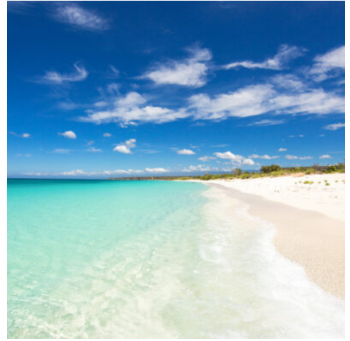
Bahia de las Águilas

Heute begeben Sie sich auf eine unvergessliche Panoramafahrt entlang der malerischen Küstenstraße bei Cabo Rojo. Die etwa zweistündige Fahrt bietet zahlreiche Gelegenheiten für Fotostopps, um die spektakulären Ausblicke und das authentische karibische Ambiente einzufangen. In La Cueva steigen Sie in ein typisches Boot, das Sie in nur 15 Minuten zu einem der schönsten Naturstrände der Welt bringt: Die Bahía de las Águilas , gelegen im Nationalpark Jaragua , begeistert mit einer rund acht Kilometer langen, nahezu unberührten Küstenlandschaft. Hier verschmilzt das kristallklare Wasser in betörenden Türkis- und Opalblautönen mit dem Horizont. Genießen Sie Ihren Aufenthalt an diesem paradiesischen Strand, tauchen Sie ein in die Essenz der Karibik, nehmen Sie sich Zeit zum Schwimmen und lassen Sie sich von der Ursprünglichkeit und Ruhe der Natur verzaubern. Auf dem Rückweg erwartet Sie in einem lokalen Restaurant ein traditionelles Mittagessen, das Ihnen die authentischen Aromen der Karibik näherbringt. Der restliche Tag steht Ihnen zur freien Verfügung. (F M)