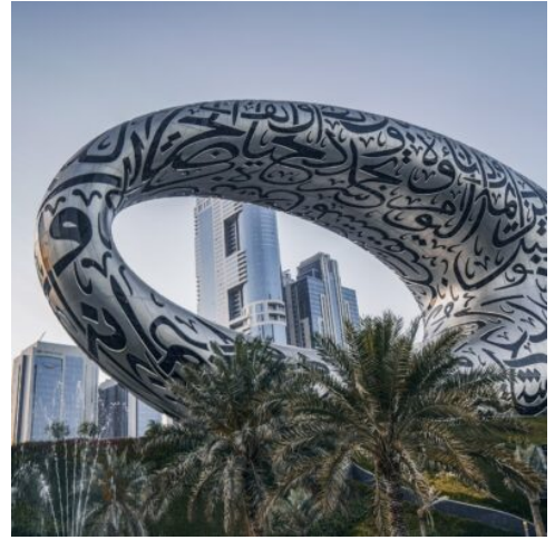
Museum of the Future

Frühstück und Freizeit. Beim heutigen Ausflug werden Sie am frühen Nachmittag mit Geländefahrzeugen (englischsprachige Fahrer ohne Reiseleitung- 6 Personen pro 4x4) zu einer aufregenden Wüstensafari gebracht. Im Herzen der Wüste, auf dem Weg zum Camp, wird Ihr Fahrer beim „Dune bashing“ seine Erfahrungen bei der Durchquerung der goldenen Dünen demonstrieren. Anschließend geht es zum Beduinencamp, um Ihr BBQ- Abendessen zu genießen, währenddessen Sie einen Bauchtanz Show bewundern können. Ihr Fahrer begleitet Sie anschließend zurück zum Hotel. (F)