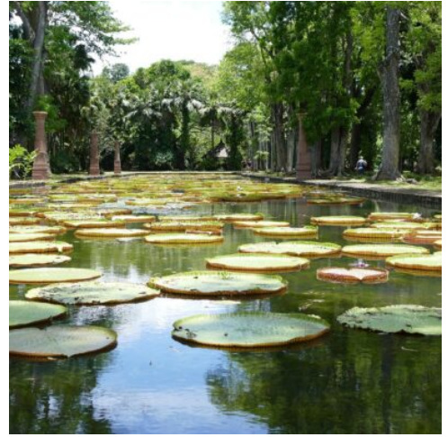
Botanischer Garten Pamplémousse

Nach dem Frühstück machen Sie sich auf den Weg in den Südwesten. Zuerst steht der Besuch des ruhenden Vulkans Trou aux Cerfs auf dem Programm, der von einem üppigen grünen Wald umgeben ist. Weiter führt die Tour zum Grand Bassin-See und dessen Tempel, bekannt als heiliger Ort für Hindus. Weiter geht die Fahrt zum Black River Gorges Nationalpark. Sie finden hier mehr als 300 Pflanzenarten und neun Vogelarten, die es nur auf Mauritius gibt. Bei einem Fotostopp genießen Sie spektakulärste Ausblicke auf grüne Täler, grandiose Wasserfälle und dichte Regenwälder. Danach erleben Sie eine Führung durch die Rumdestillerie La Rhumerie de Chamarel, Rumverkostung inklusive. Zum Abschluss bewundern Sie den ca. 90 m hohen Wasserfall von Chamarel und die „Siebenfarbige Erde“, Sanddünen die in 7 verschiedenen Farben schimmern. (F M A)