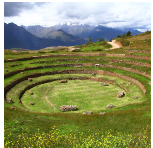
Inka-Terrassen von Moray

Die einstige Inkahauptstadt, auf einer Höhe von 3.400 m gelegen, fasziniert durch eine einzigartige Mischung von spanischem Kolonialstil und traditioneller Baukunst der Inka. Die imposante Kathedrale der Jungfrau Maria Himmelfahrt beeindruckt mit reichen Holzschnitzereien und einem prächtigen Altar. Die Ruinen des Sonnentempels Koricancha erinnern an eine Zeit, in der Cusco die mächtige Hauptstadt des Inkareichs war. Folgen Sie auf der berühmten Straße Hatunrumiyoc der steinernen Mauer, in der sich die präzise Baukunst der Inkas offenbart. Sie machen einen letzten Stopp im San Blas Kunsthandwerkerviertel. Die sagemumwobenen Kopfsteinpflastergassen bieten nicht nur spektakuläre Ausblicke auf die Stadt, sie sind auch mit Werkstätten und Galerien gesäumt, die dem Viertel seine künstlerische Atmosphäre verleihen. Ein besonders schöner Blick über die Stadt erwartet Sie von der Festung Sacsayhuaman aus, die hoch über der Stadt auf einem Hügel thront. Den krönenden Abschluss des Tages bildet die Tempelanlage von Kenko. Das Höhlensystem gewährt einen faszinierenden Einblick in die Religion der Inka und die Verehrung der Pachamama, der „Mutter Erde“. (F)