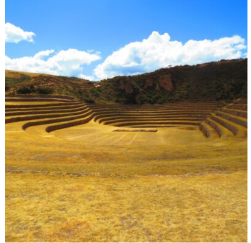
Inka-Terrassen von Moray

Nehmen Sie Abschied von Peru. Lassen Sie die letzten Tage bei einem gemütlichen Spaziergang durch den Park von Miraflores Revue passieren, ehe Sie mit vielen neuen Eindrücken im Gepäck Ihren Rückflug nach Deutschland antreten.