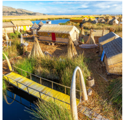
schwimmende Schilfinselfn der Uros im Titicacasee

Früh am Morgen fahren Sie zum spektakulären Aussichtspunkt Cruz del Condor, wo Ihnen der majestätische Flug der Kondore ein einzigartiges Schauspiel bietet. Auf dem Rückweg nach Chivay beeindruckt das verschlafene Dorf Yanque mit der ersten Kirche des Colca-Tals. Nach dem Frühstück verlassen Sie das Tal und setzen Ihre Reise in das zentrale Hochland Perus fort. In Höhen von bis zu 4.000 m streifen Vicuña- und Alpakaherden durch die steppenartige Landschaft, die in die größte Salzwüste der Welt übergeht. Sie verbringen die Nacht in Puno, am Ufer des Titicacasees. (F)