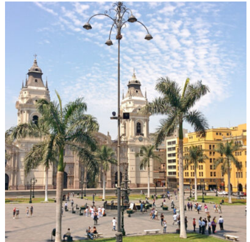
Plaza de Armas in Lima

Als wirtschaftliches und kulturelles Zentrum Perus begeistert die Metropole am Pazifik mit zahlreichen Sehenswürdigkeiten, die sich Ihnen bei Ihrer heutigen Sightseeing-Tour im schönsten Licht präsentieren. Schlendern Sie zwischen Plaza Mayor und Plaza San Martín durch das historische Zentrum der Stadt, das zum UNESCO-Weltkulturerbe zählt, und lassen Sie sich von der faszinierenden Architektur bezaubern. Zwischen Villen und dem prächtigen Stadtpalast erwartet Sie das pittoreske Kloster Santo Domingo, das mit seiner schönen Architektur, zahlreichen Mosaiken und einem idyllischen Garten begeistert. Anschließend erwartet Sie mit der Universität San Marcos die älteste Universität Südamerikas. Streifen Sie durch das historische Künstlerviertel Barranco, das mit einem einzigartigen Charme verzaubert, ehe Sie auf der hölzernen Puente de los Suspiros mit einem beeindruckenden Blick über das bunte Treiben belohnt werden. (F)