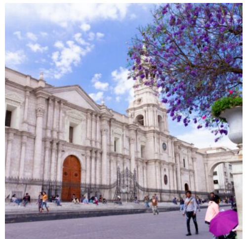
Plaza de Armas in Arequipa

Heute entdecken Sie die weiße Stadt Arequipa. Ihren Beinamen verdankt sie ihren Gebäuden aus hellem Vulkangestein, die die gesamte Stadt in strahlendes Weiß tauchen. Lassen Sie sich bei einer Stadtführung durch die schmalen Gassen vom einzigartigen Charme Arequipas verzaubern. Die Architektur ist geprägt von der Baukunst der spanischen Kolonialzeit, in dem sich verschiedenste Stile seit dem europäischen Barock vereinen. Im Kloster Santa Catalina erwartet Sie der wohl geheimnisvollste Teil der Stadt. Hohe Mauern umgeben das Viertel und schützten den Klosterbezirk und seine adeligen Bewohnerinnen jahrhundertlang vor den Wirren der Stadt, denn bis in die 1970er Jahre hinein entsagten die Nonnen gänzlich dem Kontakt zur Außenwelt. Ihr nächstes Ziel führt Sie ein Stückchen aus der Stadt hinaus zum Aussichtspunkt Yanahuara, von wo sich Ihnen ein atemberaubender Blick über die von Vulkanen umgebene Stadt bietet. Gestalten Sie den Rest des Tages frei nach Ihren Vorlieben. Streifen Sie durch die schmalen Gässchen, schlendern Sie über traditionelle Märkte und den malerischen Plaza de Armas und besuchen Sie die berühmte Kathedrale, die als die schönste des Landes gilt. (F)