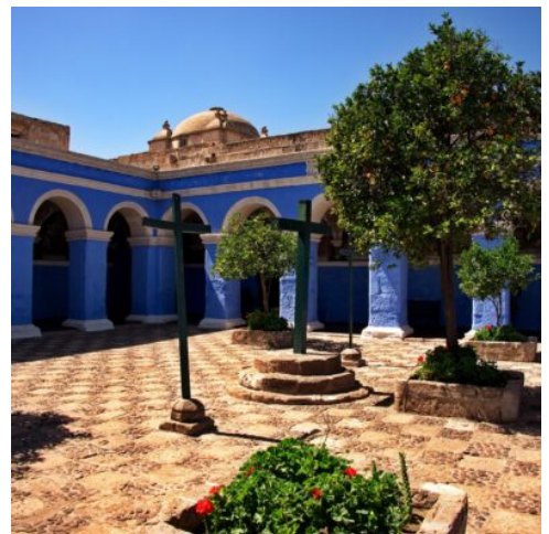
Kloster Santa Catalina in Arequipa

Heute entdecken Sie die weiße Stadt Arequipa. Ihren Beinamen verdankt sie ihren Gebäuden aus hellem Vulkangestein, die die gesamte Stadt in strahlendes Weiß tauchen. Lassen Sie sich bei einer Stadtführung durch die schmalen Gassen vom einzigartigen Charme Arequipas verzaubern. Die Architektur ist geprägt von der Baukunst der spanischen Kolonialzeit, in dem sich verschiedenste Stile seit dem europäischen Barock vereinen. Im Kloster Santa Catalina erwartet Sie der wohl geheimnisvollste Teil der Stadt. Hohe Mauern umgeben das Viertel und schützten den Klosterbezirk und seine adeligen Bewohnerinnen jahrhundertlang vor den Wirren der Stadt, denn bis in die 1970er Jahre hinein entsagten die Nonnen gänzlich dem Kontakt zur Außenwelt. Ihr nächstes Ziel führt Sie ein Stückchen aus der Stadt hinaus zum Aussichtspunkt Yanahuara, von wo sich Ihnen ein atemberaubender Blick über die von Vulkanen umgebene Stadt bietet. Gestalten Sie den Rest des Tages frei nach Ihren Vorlieben. Streifen Sie durch die schmalen Gässchen, schlendern Sie über traditionelle Märkte und den malerischen Plaza de Armas und besuchen Sie die berühmte Kathedrale, die als die schönste des Landes gilt. (F)