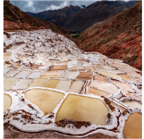
Salzterrassen von Maras

Der heutige Tag hält ein ganz besonderes Erlebnis für Sie bereit. Eine kurze Fahrt bringt Sie zur Bahnstation von Ollantaytambo, wo Sie eine exklusive Fahrt mit dem Voyager Train entlang des Urubamba-Flusses nach Aguas Calientes erwartet. Lassen Sie die atemberaubenden Flusslandschaften auf sich wirken, mächtige Berge und traditionelle Terrassen gleiten an Ihnen vorbei und versüßen Ihnen die Reise zu einem der Highlights von Peru: Machu Picchu. Am Ende einer steilen Serpentinstraße, hoch in den Bergen, ruhen die mächtigen Ruinen der einstigen Inka-Stadt. Einzig aus Stein erschufen die Inkas die Stadt, nur um Sie wenige Jahrzehnte später zu verlassen. Unberührt von den spanischen Eroberern, stieß erst 1911 der Forscher Hiram Bingham auf die verwitterten Mauern der mächtigen Anlage. Streife Sie durch die altherwürdigen Mauern und genießen Sie die einzigartige Atmosphäre eines Bauwerks, das der Forschung noch heute Rätsel aufgibt. (F M)