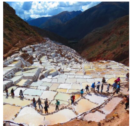
Salztterrassen von Maras

Die einstige Inkahauptstadt, auf einer Höhe von 3.400 m gelegen, fasziniert durch eine einzigartige Mischung von spanischem Kolonialstil und traditioneller Baukunst der Inka. Die imposante Kathedrale der Jungfrau Maria Himmelfahrt beeindruckt mit reichen Holzschnitzereien und einem prächtigen Altar. Die Ruinen des Sonnentempels Koricancha erinnern an eine Zeit, in der Cusco die mächtige Hauptstadt des Inkareichs war. Folgen Sie auf der berühmten Straße Hatunrumiyoc der steinernen Mauer, in der sich die präzise Baukunst der Inkas offenbart. Sie machen einen letzten Stopp im San Blas Kunsthandwerkerviertel. Die sagenumwobenen Kopfsteinpflastergassen bieten nicht nur spektakuläre Ausblicke auf die Stadt, sie sind auch mit Werkstätten und Galerien gesäumt, die dem Viertel seine künstlerische Atmosphäre verleihen. Ein besonders schöner Blick über die Stadt erwartet Sie von der Festung Sacsayhuaman aus, die hoch über der Stadt auf einem Hügel thront. Den krönenden Abschluss des Tages bildet die Tempelanlage von Kenko. Das Höhlensystem gewährt einen faszinierenden Einblick in die Religion der Inka und die Verehrung der Pachamama, der „Mutter Erde“. (F)