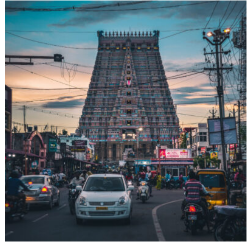
Tiruchirappalli, Tamil Nadu

Besuch des Brihadeswara-Tempel. Der Tempel wurde im 10. Jahrhundert vom großen Chola-König erbaut und ist ein herausragendes Beispiel der Chola-Architektur. Er gehört zum UNESCO Weltkulturerbe. Die Kuppel auf dem 63 Meter hohen Scheitelpunkt besteht aus einem einzigen Stück Granit mit einem geschätzten Gewicht von 81 Tonnen. Danach geht es weiter zum Thanjavur Palace & Museum. Der Palast in der Nähe des Brihadeswara-Tempels ist ein riesiges Gebäude aus Mauerwerk, das teils von den Nayakas und teils von den Marathas um 1550 erbaut wurde. Zwei der Palasttürme, die Waffenkammer und der Aussichtsturm, sind von allen Teilen der Stadt aus sichtbar. Der Palast beherbergt eine Kunstgalerie, eine Bibliothek und einen Musiksaal. (F A)