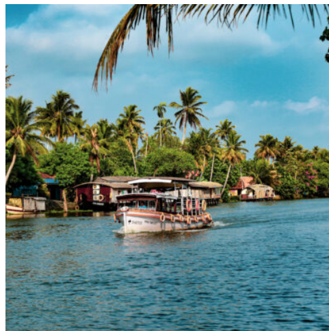
Wasserstraße in Kumarakom, Kerala

Nach dem Frühstück unternehmen Sie einen Spaziergang im Park. Mit ein wenig Glück haben Sie die Gelegenheit, verschiedene Vogelarten, Schmetterlinge und Tiere zu beobachten. Sie besuchen das Periyar's Elephant Camp – ein Erlebnis, bei dem Sie den prächtigen Elefanten ganz nahekommen. Später genießen Sie eine Bootsfahrt durch den Periyar-Nationalpark. (F A)