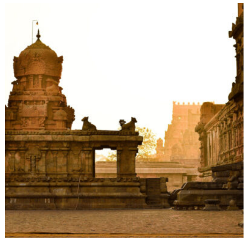
Thanjavur, Tamil Nadu

Nach dem Frühstück unternehmen Sie eine Stadtrundfahrt. Besuch des Aurobindo Ashrams im November 1926 gegründet. Später besichtigen Sie Notre Dame des Anges (die Kirche Unserer Lieben Frau von den Engeln) in der Rue Dumas. Der Bau zeichnet sich durch sein Mauerwerk aus feinstem Kalkstein aus, der mit Eiweiß vermischt wurde. Genießen Sie am Nachmittag einen Heritage Walk in Pondicherry. Dieser Spaziergang führt Sie durch das französische Viertel. Sie besichtigen die weniger bekannten, interessanten Gebäude und Denkmäler, darunter den wunderschönen kleinen Ganesha-Tempel, den Ayi Mandapam, das französische Kriegsdenkmal, die Gandhi-Statue, den Ashram-Speisesaal, den alten Leuchtturm und vieles mehr. (F A)