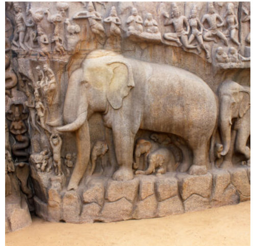
Mahabalipuram, Tamil Nadu

Ankunft am frühen Morgen. Begrüßung durch die örtliche Reiseleitung. Am Nachmittag unternehmen Sie eine Stadtrundfahrt durch Chennai. Sie besuchen den Kapaleshwara-Tempel in Mylapore, der Gott Shiva gewidmet ist und ein gutes Beispiel für die farbenfrohe Tempelarchitektur Südindiens darstellt. Die portugiesische Kathedrale St. Thomas Church aus dem 16. Jahrhundert beherbergt die Überreste des Heiligen Thomas, der 52 n. Chr. nach Indien kam. Sie passieren die im indischen Stil erbaute Universität sowie den 5 km langen Marina Beach, eine schöne Strandpromenade am Meer. (F A)