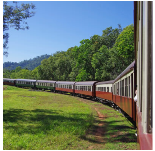
Zug nach Kuruanda

Früh am Morgen brechen Sie auf für Ihren Flug in den Westen Australiens in die charmante Stadt Perth. Am Abend treffen Sie dort ein und fahren direkt ins Hotel. (F)