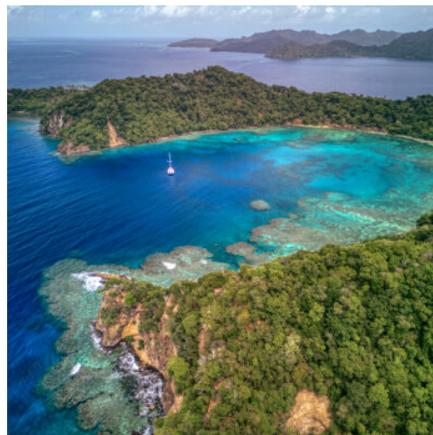
Matangi Private Island Resort

Beschreibung des Resorts: Matangi Private Island Resort – ein Ort, an dem man sofort ankommt und den Alltag hinter sich lässt. Die kleine Privatinsel im Nordosten Fidschis ist von Regenwald, weißen Stränden und türkisblauem Meer umgeben und wirkt eher wie ein verborgenes Refugium als wie ein klassisches Hotel. Es gibt nur wenige Bungalows und drei außergewöhnliche Baumhäuser, die sich ruhig und harmonisch in die Natur einfügen – ohne Straßen, ohne Hektik, ohne Ablenkung.