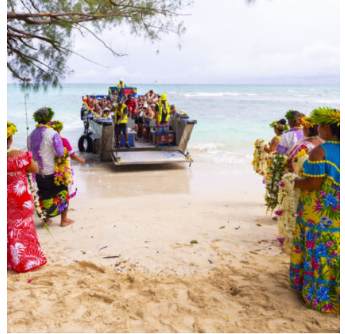
Ankunft auf Raivavae

Raivavae, oft „Bora Bora von damals“ genannt, überzeugt mit Motu, Traditionen und authentischem Inselcharme. In Rairua werden Sie mit Musik und Blumenkränzen empfangen, bevor eine Inselrundfahrt zum „lächelnden Tiki“, zu Marae und einer Weihwasserverkostung führt. Nach einem traditionellen Buffet folgt ein Dorfrundgang. Am nächsten Tag stehen eine Wanderung auf den Heirani oder die Entdeckung der „Pupu“-Muschelketten auf dem Programm. Optional kann das Motu Vaiamanu mit seinem schönen Korallengarten besucht werden. (F M A)