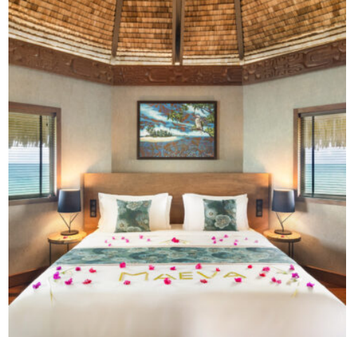
Komfort trifft Paradies: Suite Pilotis auf Tikehau

Ein Flug bringt Sie in das unberührte Atoll Tikehau, ein Paradies für Ruhesuchende. Das Le Tikehau by Pearl Resorts liegt direkt an der Lagune mit schneeweißen Stränden. Willkommen im Rückzugsort fernab der Welt. (F)