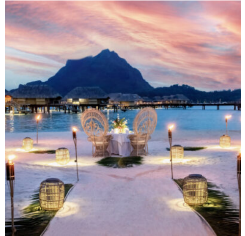
Romantik pur auf Bora Bora

Nach der Ankunft auf Tahiti und dem Transfer per Boot erreichen Sie die duftende „Vanille-Insel“ Tahaa. Das Le Taha'a by Pearl Resorts begrüßt Sie mit eleganten Pool Beach Villas und traumhaftem Blick auf die Lagune. Genießen Sie die Ruhe, das sanfte Rauschen der Wellen und stoßen Sie auf den Beginn Ihrer gemeinsamen Reise an. (F)