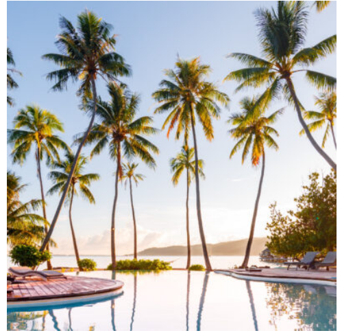
Blaues Paradies – Swimming Pool Le Taha'a

Am vorletzten Tag fliegen Sie zurück nach Tahiti. Das Le Tahiti by Pearl Resorts bietet Ihnen ein komfortables Zimmer mit Blick auf den schwarzen Sandstrand. Nutzen Sie den Nachmittag für einen Spaziergang entlang der Küste oder letzte Souvenirs in Papeete. (F)