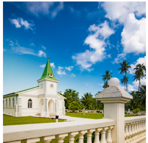
Kirche auf Moorea

Heute werden Sie von Ihrem Hotel zum Domestic Airport gebracht und fliegen weiter nach Huahine. Nach Ankunft werden Sie zu Ihrem Hotel gebracht. (F)