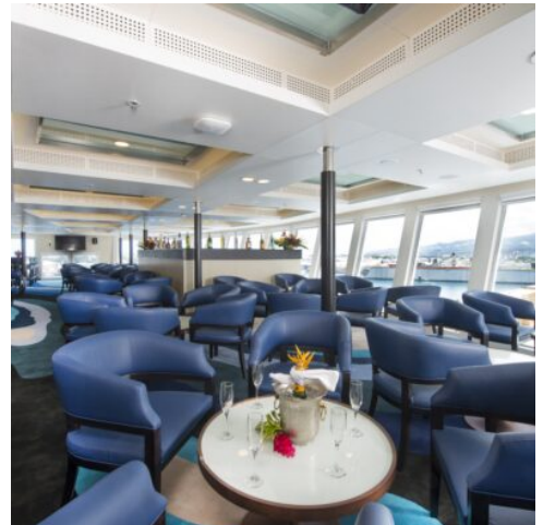
Aranui 5 - Sky Bar

Aufgrund des Phosphatabbaus von 1917 bis 1964 war es einst ein wohlhabendes Atoll, heute ist es fast vollständig verlassen und es sind nur noch wenige Familien übrig. Heute leben die Einwohner vom Kopraanbau, der Fischerei und dem Handel mit Kokosnusskrabben. Es bietet sich die Möglichkeit, die Überreste der Vergangenheit Makateas und der Phosphatgewinnung zu besichtigen. Die Passagiere steigen per Tender am Temoa-Pier aus und beginnen die Reise durch das Atoll zu Fuß oder mit dem Auto. Besuchen Sie die heiligen Höhlen von Makatea und machen Sie ein Picknick unter den Klippen oder am Strand. (F M A)