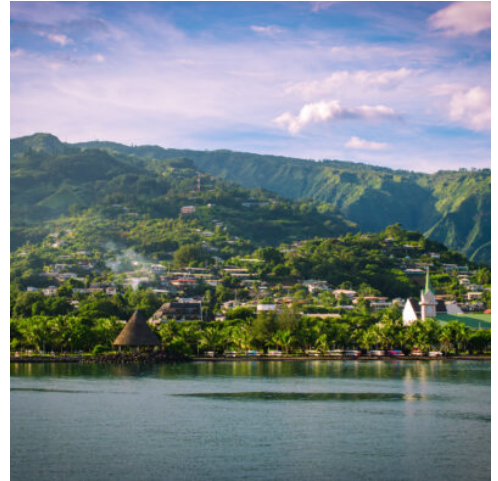
Papeete auf Tahiti

Fakarava wurde von der UNESCO zum Schutz seltener Arten als Biosphärenreservat eingestuft und ist das zweitgrößte Atoll in Französisch-Polynesien. Die Aranui wird am Pier „Rotoava“ anlegen. Sie haben Zeit, das kleine Dorf, die aus Korallen gebaute Kirche und das örtliche Kunsthandwerk zu entdecken. Genießen Sie einen Tag voller Entspannung, Sonne und Strand, Schwimmen oder Schnorcheln zwischen bunten tropischen Fischen. Für zertifizierte Taucher besteht die Möglichkeit zum Tauchen. Optionale Aktivitäten: Fahrradverleih, E-Bike, Quad, zertifiziertes Tauchen (Anmeldung an der Rezeption). (F M A)