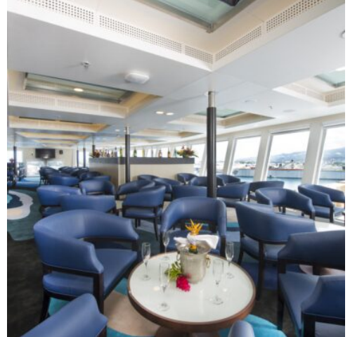
Aranui 5 - Sky Bar

Bereits sehr früh am Morgen geht die Aranui am Tahauku-Kai vor Anker. Sie haben Zeit, das Dorf zu erkunden. Es ist übrigens das zweitgrößte der Marquesas-Inseln. Hier lebte Paul Gauguin und schuf einen Teil seiner Werke. Sie können noch heute genau den Kolonialwarenladen besuchen, in dem er sein Brot kaufte. Besuchen Sie auch die Replik seines berühmten „House of Pleasure“ und das Museum. Wenn Sie den Hügel zum Friedhof hinauflaufen, haben Sie einen atemberaubenden Blick auf Motu Hanakee. Unter einem riesigen Frangipani-Baum befindet sich ein Grabstein mit den einfachen Worten: Paul Gauguin 1903. Ganz in der Nähe liegt das Grab eines weiteren berühmten Europäers, der ebenfalls von Hiva Oa begeistert war: der belgische Sänger und Komponist Jacques Brel, der 1978 verstarb. (F M A)