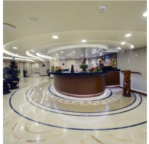
Aranui 5 - Rezeption

Fakarava ist das zweitgrößte Atoll in Französisch-Polynesien und wird von der UNESCO als Biosphärenreservat für die Erhaltung seltener Arten geschützt. Nach einem Buffet auf der Aranui geht es an der Anlegestelle von „Rotoava“ von Bord. Passagiere haben Zeit, das kleine Dorf zu erkunden, die aus Korallen erbaute Kirche zu besichtigen und das örtliche Kunsthandwerk kennenzulernen. Eine spannende Demonstration zeigt, wie vielfältig die Kokosnuss verwendet werden kann. Genießen Sie einen Tag voll Entspannung, Sonne und Strand. Schwimmen oder Schnorcheln Sie zwischen bunten tropischen Fischen. (F M A)