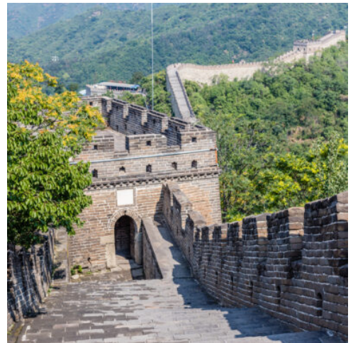
Große Mauer bei Juyongguan

Ankunft in Peking am frühen Nachmittag und Begrüßung durch Ihre deutschsprachige Reiseleitung am Bahnhof. Transfer zum Hotel, Zeit zur freien Verfügung. Übernachtung im Superior-Hotel in Peking.