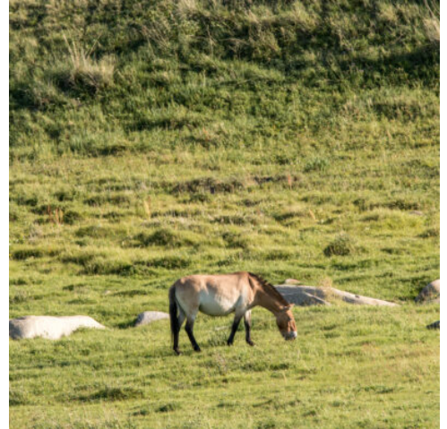
Wildpferd Przewalski im Khustain Nuruu Nationalpark

Nach dem Frühstück im Camp fahren Sie zum Ugii-See und machen unterwegs einige Stopps, um die bezaubernde Landschaft und Tierwelt zu fotografieren. Nach der Ankunft am Ugii-See, wandern Sie am Abend um den See und können die Vögel und die Natur beobachten. Abendessen und Übernachtung im Camp Ugii Hishig (Gemeinschafts -WC/Duschen). (F M A)