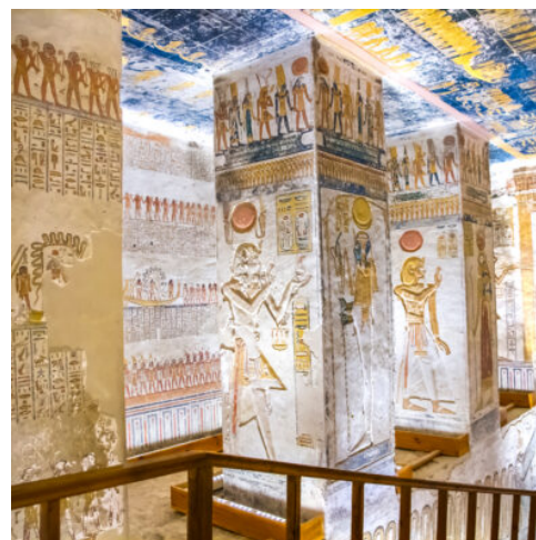
Tal der Könige

Herrliche Tage reich an Eindrücken und faszinierenden Momenten liegt nun hinter Ihnen und es heißt Abschied zu nehmen. Am frühen Morgen erfolgt der Transfer zum Flughafen für den Rückflug nach Deutschland oder optional zu Ihrem Badeaufenthalt am Roten Meer. (F)