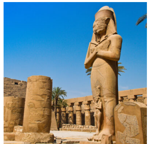
Karnak Tempel in Luxor, Ägypten

Am frühen Morgen besuchen Sie die Tempel von Luxor und Karnak, zwei der eindrucksvollsten Kultstätten des alten Ägyptens. Der Karnak-Tempel, die wohl größte Tempelanlage des Landes und einstiges religiöses Zentrum im alten Ägypten stammen aus der 12. Dynastie unter Sesostris I. Bis in die römische Kaiserzeit wurde die gesamte Anlage immer wieder erweitert und umgestaltet. Gemeinsam mit dem Luxor-Tempel steht der Karnak-Tempel unter dem Schutz der UNESCO. Der Luxor-Tempel zählt zu den schönsten Tempeln Ägyptens, er ist mit dem Karnak-Tempel durch eine von Widderfiguren gesäumte Prozessionsstraße verbunden. Die Tempelstadt von Karnak überwältigt als wohl größte Tempelruine der Welt und übt seit jeher eine große Anziehungskraft auf ihre Besucher aus. Freuen Sie sich nach der Rückkehr zum Schiff auf einen freien Nachmittag und Abend, den Sie ganz nach Ihrer eigenen Façon gestalten können. Abendessen und Übernachtung an Bord. (F M A)