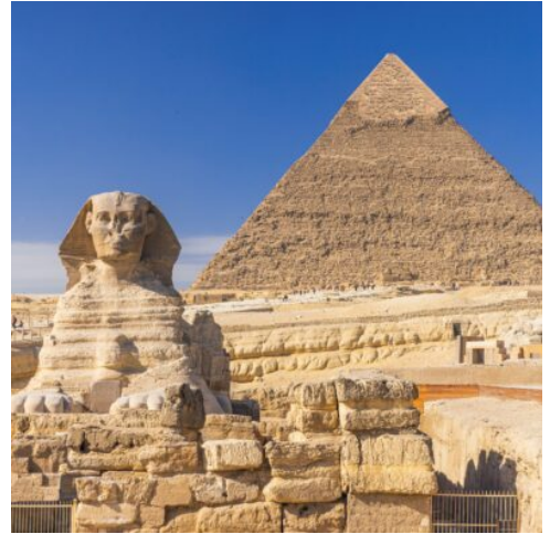
Khafre Pyramide mit Sphinx in Gizeh

Gleich zum Beginn Ihrer Erkundungen begeben Sie sich auf eine faszinierende Zeitreise und lernen einzigartige Monumente von Weltrang kennen. Ihr erster Stopp Memphis, etwa 3.000 v.Chr. entstanden, befindet sich nicht weit von Kairo entfernt am Rande der westlichen Wüste. Als Bindeglied zwischen Ober- und Unterägypten war es von wirtschaftlicher und kultureller zentraler Bedeutung, wie Sie erfahren werden. Von Memphis aus geht es weiter nach Sakkara, der riesigen Nekropole des alten Memphis, deren archäologisches Highlight die Stufenpyramide von Djoser darstellt. Nach dem Mittagessen krönen die drei weithin sichtbaren überwältigenden Pyramiden von Gizeh die heutigen Entdeckungen, sie sind das einzige, noch erhaltene Weltwunder der Antike. Lassen Sie sich von der Kulisse der weltberühmten Cheops-Pyramide, der größten von den drei königlichen Grabmalen und in der 4. Dynastie um 2690 v. Chr. erbaut, in den Bann ziehen. Vor der Chephren-Pyramide steht die ebenfalls legendäre Große Sphinx, deren anmutige Darstellung als Löwe mit dem Kopf eines Pharaos verblüfft. Sie wurde vermutlich in der 4. Dynastie während der Herrschaft von Chephren errichtet. Optional können Sie auch das Innere der Pyramide besichtigen, dann geht es zurück zu Ihrem Hotel. (F M A)