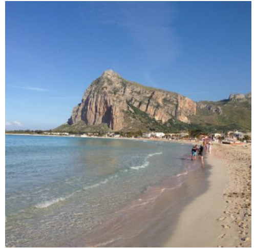
Vito Lo Capo

Nach dem Frühstück Fahrt zum Zingaro Park, ein wunderschönes Naturschutzgebiet am Meer. Hier wächst die Zwergpalme ( Chamaerops humilis ) die einzige wildwachsende Palmenart in Europa. Bei einer leichten Wanderung am Meer bewundern Sie die traumhaften Buchten. Mittagspause in San Vito Lo Capo, der schöne Badeort an der Westseite der Insel. Weiter nach Erice, auf dem Monte San Giuliano auf 751m Höhe thronend. Einzigartig sind die Panoramablicke die man von hier aus genießt, sei es nach Trapani und die Ägadischen Inseln, als auch zum Monte Cofano. Wir unternehmen einen Spaziergang durch die malerischen mittelalterlichen Straßen und sehen die Hauptkirche „Maria Assunta“, die mächtigen Stadtmauern aus phönizischer Zeit und die Reste der Venusburg. Eine Probe der köstlichen Ericini (Plätzchen) darf natürlich nicht fehlen, bevor wir Erice verlassen. (F, A)