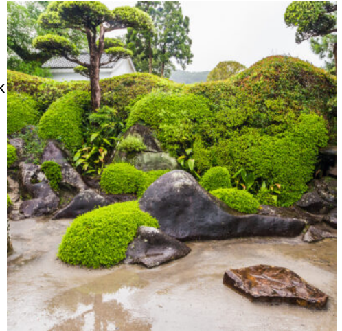
Samurai Garten in Chiran

Heute erleben Sie den japanischen Hochgeschwindigkeitszug Shinkansen in seiner ganzen Faszination: In rund fünf Stunden legt der legendäre "Bullet Train" die knapp 900 Kilometer zur Insel Kyūshū zurück – pünktlich auf die Minute, gleitend auf dem Gleis, während die japanische Landschaft vor Ihren Fenstern vorbeifliegt. Damit Sie die Zugreise bequem genießen können, schickt Ihre Reiseleitung Ihren großen Koffer bereits heute Morgen voraus nach Kumamoto. Willkommen in Kagoshima, der Stadt am Fuße des Vulkans! Nur vier Kilometer vom Stadtzentrum entfernt raucht und brodeln der Sakurajima, einer der aktivsten Vulkane Japans. Vom Aussichtspunkt im Shiroyama-Park genießen Sie einen atemberaubenden Panoramablick auf die Stadt und „ihren“ Vulkan. (F)