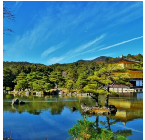
Goldener Pavillon in Kyoto

Nach der Ankunft am Flughafen begrüßt Sie Ihre deutschsprachige Reiseleitung und begleitet Sie per Bus in Ihr Hotel in Osaka. Am Abend lernen Sie beim gemeinsamen Spaziergang durch das bunte Viertel Dotonbori das pulsierende Nachtleben Osakas kennen. Leuchtende Neonreklamen, einladende Restaurants und die berühmte Glico-Mann-Werbung sorgen für den ersten japanischen Wow-Moment.