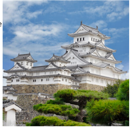
Burg des weißen Reihers

In nur einer Stunde bringt Sie der Shinkansen heute nach Kumamoto, der Samurai-Hauptstadt Kyushus. Im Mittelpunkt steht die majestätische Burg Kumamoto, eine der bedeutendsten und eindrucksvollsten Festungen ganz Japans. Die Burg ist untrennbar mit dem Satsuma-Aufstand von 1877 verbunden, der letzten großen Samurai-Rebellion, in der kaiserliche Truppen unzufriedene Samurai über Wochen belagerten und die Burg niemals fiel. Anschließend besuchen Sie den bezaubernden Suizenji-Garten, ein Meisterwerk japanischer Gartenkunst. Das Gelände stellt in miniaturisierter Form die 53 Stationen des Tokaido-Weges zwischen Tokio und Kyoto dar. Im Teepavillon des Gartens gönnen Sie sich eine stille Pause bei einer traditionellen Teezeremonie. Bequem und stilvoll erkunden Sie Kumamoto mit der historischen Straßenbahn, die seit über hundert Jahren in Betrieb ist. (F)