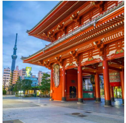
Sensoji Tempel in Asakusa Tokio

Heute fahren Sie bequem per Shinkansen in ca. 2,5 Stunden nach Tokio. Um Tokio am besten erkunden zu können, nutzen Sie heute die U-Bahn. Auf diese Weise erhalten Sie auch gleich einen Eindruck vom Leben in der Stadt. Ihre Reiseleitung führt Sie geschickt durch das verzweigte Netz der meistgenutzten U-Bahn der Welt. Sie fahren in das traditionelle Viertel Asakusa. Hier hat sich noch der alte Charakter der Stadt bewahrt. Obwohl es vom schweren Kanto-Erdbeben 1923 nicht verschont wurde, beeindrucken neben der zauberhaften Atmosphäre der Asakusa-Tempel und das Donnertor sowie die traditionelle Ladenstraße Nakamise. (F)