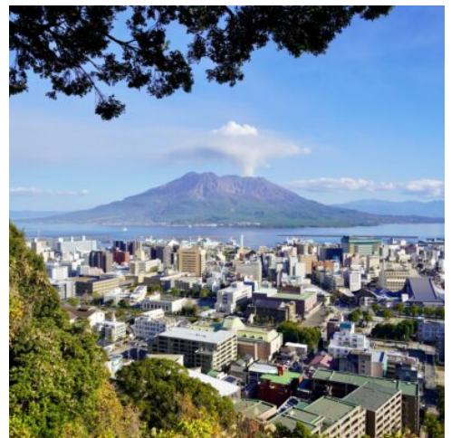
Blick vom Shiroyama-Park auf den Sakurajima

Kyoto war über tausend Jahre lang Kaiserresidenz und ist bis heute das spirituelle und kulturelle Herz Japans. Beim morgendlichen Spaziergang erkunden Sie von außen die weitläufige Anlage des ehemaligen Kaiserpalasts Kogusho, der nicht nur für seine historische Bedeutung bekannt ist, sondern auch für seine weitläufigen Parks und stillen Spazierwege. Ein entspannter Bummel durch diese grüne Oase mitten in der Stadt gibt Ihnen das Gefühl, in die kaiserliche Geschichte Kyotos einzutauchen. Anschließend besuchen Sie den Ginkaku-ji (Silberner Pavillon), einen Tempel von stiller Schönheit, dessen Gartenanlage eine meisterhafte Mischung aus Kieswegen, silbrig schimmernden Moosflächen und plätschernden Wasserläufen bietet. Auf dem berühmten Philosophenweg – einem zwei Kilometer langen Kanalweg gesäumt von hunderten Kirschbäumen – wandern Sie weiter zum Eikandō-Tempel, dessen Pagode einen atemberaubenden Blick über die Stadt bietet. (F)