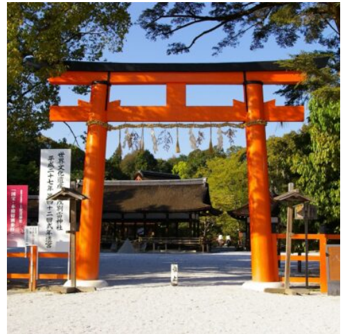
Kamigamo-Schrein in Kyoto

Ankunft in Japan und Transfer in Eigenregie nach Kyoto (Transfer optional zubuchbar, siehe Wunschleistungen). Nachmittags heißt Ihre Reiseleitung Sie herzlich in der Hotellobby willkommen. Nach dem Check-in unternehmen Sie gemeinsam einen ersten Spaziergang durch Kyoto. Am Abend haben Sie die Wahl: erkunden Sie das kulinarische Angebot auf eigene Faust oder lassen Sie sich von Ihrer Reiseleitung mitnehmen in ihre Lieblingsrestaurants bei Buchung des Optionalen Dinner Pakets – Ein Abendessen in jeder Stadt (siehe Wunschleistungen) : Beim heutigen Willkommens-Dinner in einem typisch japanischen Lokal lernen Sie die japanische Küche und Ihre Reisegruppe kennen.