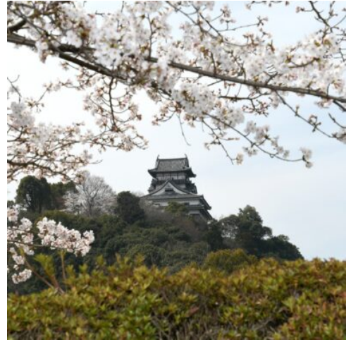
Burg von Inuyama

Ein weiteres Highlight Ihrer Japanreise: Ihre Fahrt per Bus oder Zug nach Nikko! Hier finden Sie sich inmitten einer atemberaubenden Landschaft wieder, welche die natürliche Schönheit des Schrein- und Tempelbezirks einrahmt. Bei diesem UNESCO-Weltkulturerbe erkunden Sie neben dem prunkvoll gestalteten Taiyuin-Schrein natürlich auch Nikkos Hauptschrein Toshogu. Die sehr fein gearbeitete Holzschnitzkunst verziert das Mausoleum des ersten Tokugawa Shoguns. Rückfahrt am späten Nachmittag nach Tokio, wo der Abend wieder Ihnen gehört.