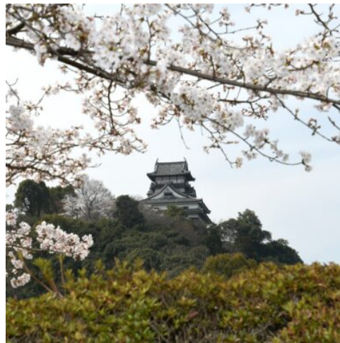
Burg von Inuyama

Sie fahren in das traditionelle Viertel Asakusa. Hier hat sich noch der alte Charakter der Stadt bewahrt. Obwohl es vom schweren Kanto-Erdbeben 1923 nicht verschont wurde, beeindrucken neben der zauberhaften Atmosphäre der Asakusa-Tempel und das Donnerort sowie die traditionelle Ladenstraße Nakamise. Vielleicht entdecken Sie sogar die Kneipe aus Wim Wenders Japan-Film „Perfect Days“! Bei guter Sicht runden Sie Ihren Besuch mit einer Auffahrt auf den höchsten Fernsehturm der Welt ab – den Tokyo Skytree mit 634 Meter Gesamthöhe. Mit einer weiteren Bahnfahrt erreichen Sie Harajuku. Still und traditionell auf der einen Seite des Bahnhofs mit dem Meiji-Park und dem gleichnamigen Schrein – edel und elegant auf der anderen Seite mit dem Boulevard Omotesando. Hier treffen Sie übrigens wieder auf ein Werk des Naoshima-Architekten Tadao Ando. Zeit für eine Pause in einem der schönen Cafés planen wir natürlich für Sie ein.