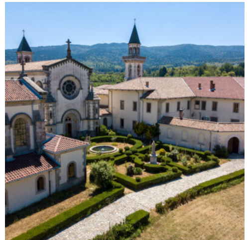
Serra San Bruno

Durch das abwechslungsreiche Landesinnere führt die Fahrt an die ionische Ostküste. Am Fuße des Aspromonte-Gebirges erwartet Sie ein außergewöhnlicher Ort: das MUSABA – ein einzigartiger Museumspark für zeitgenössische Kunst. Auf dem Gelände eines ehemaligen Klosterkomplexes aus dem 10. Jahrhundert erwartet Sie eine faszinierende Verbindung aus historischer Architektur und moderner Kunst. Anschließend geht die Reise weiter nach Gerace, eines der schönsten mittelalterlichen Städtchen Kalabriens. Aufgrund seiner zahlreichen Kirchen wird es auch liebevoll die „Stadt der 100 Kirchen“ genannt. Ein besonderer Höhepunkt ist der Besuch der normannischen Burganlage, die auf rund 480 Metern Höhe über der Stadt thront. Mit einer kleinen Bahn erreichen Sie die Burgruine und genießen von dort einen herrlichen Panoramablick über die umliegenden Berge, die Hochebenen und das funkelnde Ionische Meer. Während Ihrer Stadtführung entdecken Sie außerdem die beeindruckende Kathedrale Mariä Himmelfahrt, eine der bedeutendsten romanischen Kirchen Süditaliens, sowie die gotische Kirche San Francesco. (F A)