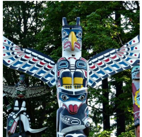
Totems Stanley Park Vancouver

Am Vormittag fahren in Sie den Tracy Arm. Steile Klippen und gletscherbedeckte Berge flankieren diesen Fjord, gesäumt vom größten intakten Küstenregenwald der Vereinigten Staaten. Gegen Mittag legen Sie in Juneau an, die ab gelegenste Landeshauptstadt der USA. Mit ihrer ursprünglichen Umgebung lockt die Stadt mit zahlreichen Aktivitäten. Wie wäre es mit einer Wanderung hinauf auf den Mount Roberts, um wilde Hirsche und Weißkopfseeadler zu beobachten? Auch eine Walbeobachtungstour zur Auke Bay bietet sich an, um den besten Blick auf diese majestätischen Kreaturen zu werfen. Wenn Sie Entdeckungen an Land bevorzugen, führt Sie ein kurzer Flug mit einem Wasserflugzeug zu einem nahegelegenen Wildreservat, wo Sie mit etwas Glück Bären zu beobachten können. (F M A)