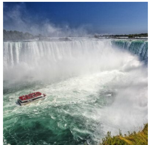
Niagara Wasserfälle Kanada

Am Morgen verlassen Sie Toronto und reisen mit dem Zug in rund zwei Stunden nach Ottawa, der eleganten Hauptstadt Kanadas. Nach der Ankunft geht es mit der Metro in wenigen Minuten ins Stadtzentrum, wo Sie eine spannende Stadtbesichtigung erwartet. Ihr Spaziergang beginnt am eindrucksvollen Canadian War Memorial und führt Sie weiter zum prächtigen Parlamentsgebäude im neugotischen Stil. Von hier genießen Sie einen herrlichen Panoramablick über die Stadt. Nicht weniger beeindruckend ist der historische Rideau-Kanal, ein UNESCO-Weltkulturerbe. Besonders faszinierend: Die Schleusen des Kanals werden bis heute von Hand bedient, ein echtes Zeugnis vergangener Ingenieurskunst. Zum Abschluss erreichen Sie den lebhaften Markt, der mit einer Vielzahl an Restaurants, Cafés und Marktständen zu kulinarischen Entdeckungen einlädt. Hier haben Sie Gelegenheit, die vielfältige kanadische und internationale Küche zu genießen. (F)