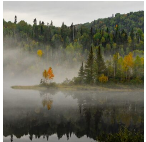
Herbst in Kanada

Heute führt Sie die Reise weiter in Richtung Westen. Zunächst besuchen Sie die Hat Creek Ranch, ein Freilichtmuseum, in dem Sie mehr über die Geschichte der ersten Siedler und der hier lebenden indigenen Völker erfahren. Nach einer kurzen Pause im kleinen Ort Lilloet geht es weiter über einen Pass in die Coastal Mountains. Am Duffey Lake legen Sie einen Fotostopp ein, um die malerische Landschaft festzuhalten. Ihre letzte Wanderung des Tages führt Sie zu den Nairn Falls, die mit ihrer Schönheit und Kraft beeindruckend sind. Die Wanderung ist leicht und bietet eine wunderbare Gelegenheit, die Natur zu genießen. Am Nachmittag erreichen Sie schließlich den weltbekannten Bergort Whistler, der einst Austragungsort der Olympischen Winterspiele 2010 war. Das Städtchen liegt beeindruckend im Schatten der Whistler Mountains und des Blackcomb Peaks. (F)