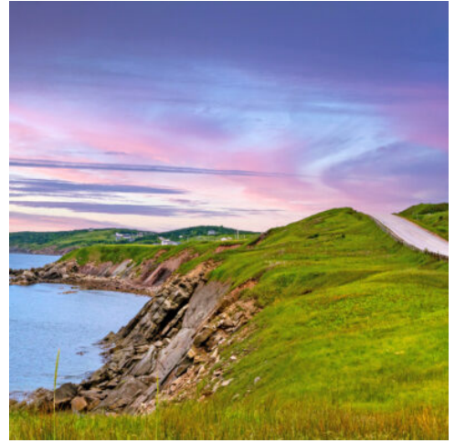
Cabot Trail - eine der schönsten Panoramastraßen Nordamerikas

Am Vormittag erreichen Sie eine der meistbesuchten historischen Stätten Kanadas, die Festung von Louisbourg. Diese liebevoll und detailgetreu restaurierte Festung war einst einer der wichtigsten Stützpunkte der französischen Kolonie. Auf dem Rückweg nach Sydney machen Sie einen weiteren Halt an der Marconi National Historic Site. (F)