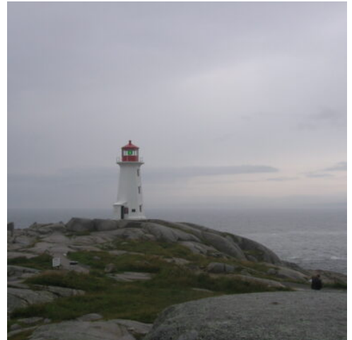
Leuchtturm von Peggy's Cove

Am Nachmittag steht ein Ausflug zum malerischen Fischerdorf Peggy's Cove auf dem Programm. Dieses charmante, idyllische Dorf ist besonders stolz auf seinen weltberühmten Leuchtturm, der oft auf Fotos verewigt wird. Hier können Sie die Schönheit in ihrer reinsten Form erleben.