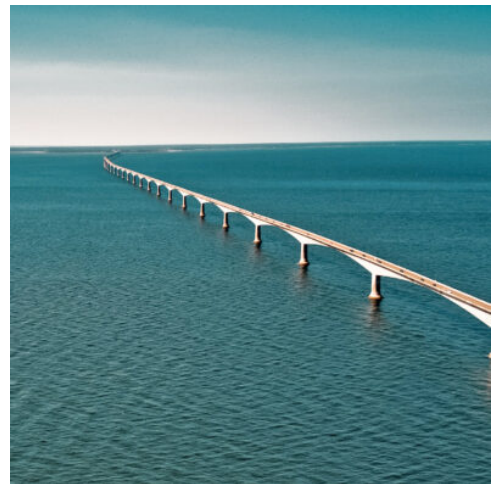
Kanadas längste Brücke: Die Confederation Bridge, Prinz-Edward-Island

Ihr erster Halt ist die Provinzhauptstadt Charlottetown, eine gemütliche Stadt mit einem leicht ländlichen Flair und beeindruckenden Gebäuden im viktorianischen und kolonialen Stil. Hier lassen Sie den Tag bei einem köstlichen Hummer-Abendessen ausklingen. (F A)