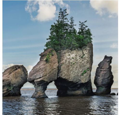
Die Meeresbucht Bay of Fundy - der weltweit größte Tidenhub

Anschließend setzen Sie Ihre Fahrt fort nach Moncton, der inoffiziellen „Hauptstadt“ der Akadier. (F)