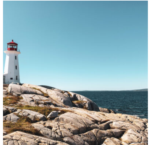
Leuchtturm von Peggy's Cove

Am Nachmittag steht ein Ausflug zum malerischen Fischerdorf Peggy's Cove auf dem Programm. Dieses charmante, idyllische Dorf ist besonders stolz auf seinen weltberühmten Leuchtturm, der oft auf Fotos verewigt wird. Hier können Sie die Schönheit in ihrer reinsten Form erleben.