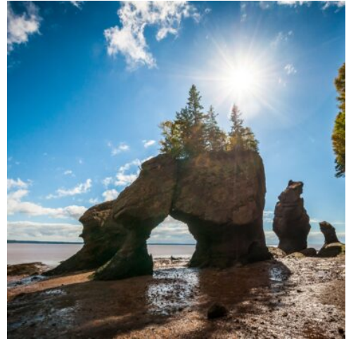
Die Meeresbucht Bay of Fundy

Anschließend setzen Sie Ihre Fahrt fort nach Moncton, der inoffiziellen „Hauptstadt“ der Akadier. (F)