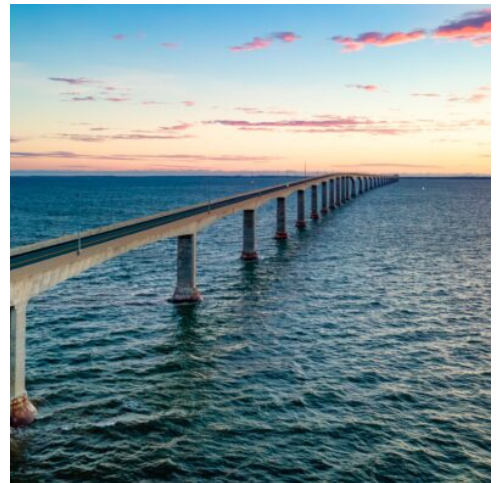
Kanadas längste Brücke: Die Confederation Bridge, Prinz-Edward-Island

Ihr erster Halt ist die Provinzhauptstadt Charlottetown, eine gemütliche Stadt mit einem leicht ländlichen Flair und beeindruckenden Gebäuden im viktorianischen und kolonialen Stil. Hier lassen Sie den Tag bei einem köstlichen Hummer-Abendessen ausklingen. (F A)