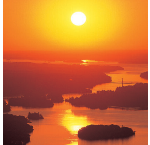
Thousand Aerial pic 03

Gestärkt durch ein ausgiebiges Frühstück folgen Sie heute Vormittag einem Naturalisten. Während des Waldspaziergangs erfahren Sie einiges über die reichhaltige Pflanzen- und Tierwelt Ostkanadas. Am Spätnachmittag unternehmen Sie eine Expedition zur Beobachtung von Bibern und Schwarzbären – ein sicherlich lange in Erinnerung bleibendes Erlebnis. Den Rest des Tages kann jeder nach seinen Wünschen gestalten: einen Spaziergang unternehmen oder einfach in dieser Oase des Wohlbefindens entspannen. Kanus, Kajaks, Tretboote, Wanderwege, Hallenbad und Sauna stehen kostenlos zur Verfügung. (F)