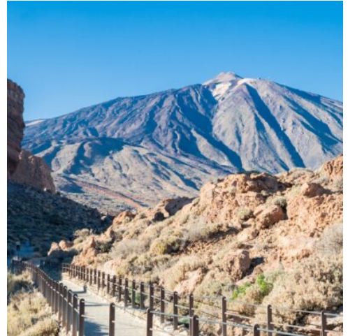
Roques de García am Teide

Zunächst entdecken Sie den historische Ort La Orotava. Bei einem Spaziergang durch die malerische Altstadt erleben Sie liebevoll erhaltene, traditionelle kanarische Häuser mit ihren kunstvoll geschnitzten Holzbalkonen, die von vergangenen Zeiten erzählen. Enge, gepflasterte Gassen, kleine Plätze und eindrucksvolle historische Gebäude verleihen dem Ort eine ganz besondere Atmosphäre, die zum Verweilen und Staunen einlädt. Im Anschluss führt Sie die Fahrt hinauf in den beeindruckenden Nationalpark Cañadas del Teide, ein UNESCO-Weltnaturerbe von außergewöhnlicher Schönheit. Bereits auf dem Weg dorthin eröffnen sich immer wieder atemberaubende Ausblicke auf die umliegende Landschaft. Im Nationalpark angekommen, erwartet Sie eine einzigartige Welt aus bizarren Felsformationen, weiten Lavafeldern und farbenreichen Vulkanlandschaften, die beinahe surreal wirken. Ein besonderes Highlight ist der Blick auf den majestätischen Teide, den höchsten Berg Spaniens, der sich eindrucksvoll über die Landschaft erhebt. Zudem besuchen Sie die berühmten Roques de García – markante Felsformationen, die zu den bekanntesten Fotomotiven Teneriffas zählen. Hier haben Sie ausreichend Zeit für Fotostopps, kurze Spaziergänge und um die außergewöhnliche Natur in Ruhe auf sich wirken zu lassen. Rückfahrt zum Hotel und Abendessen. (F A)