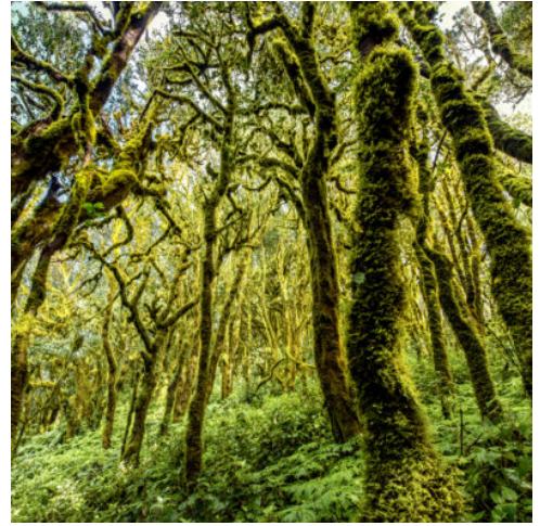
Nationalpark Garajonay auf La Gomera

Ihre Tagesfahrt führt Sie mit der Fähre zur Nachbarinsel La Gomera, die für ihre unberührte Natur, dramatischen Landschaften und ihre Ruhe bekannt ist. Bereits bei der Überfahrt eröffnet sich ein spektakuläres Panorama auf das glitzernde Meer und die Küstenlinien beider Inseln, sodass Sie gleich zu Beginn beeindruckende Fotomotive erleben. Auf La Gomera angekommen, erwartet Sie der faszinierende Nationalpark Garajonay, ein UNESCO-Weltnaturerbe, das mit seinen uralten Lorbeerwäldern ein wahres Naturparadies bildet. Beim Spaziergang durch diese mystischen Wälder tauchen Sie in eine grüne Welt voller Nebel, Moos und ungewöhnlicher Pflanzen ein, die wie aus einer anderen Zeit zu stammen scheint. Sie besuchen ausgewählte Aussichtspunkte, wie zum Beispiel den Mirador de los Roques, von dem aus Sie atemberaubende Panoramablicke über zerklüftete Felsen, tiefe Schluchten und das endlose Blau des Atlantiks genießen. Zudem entdecken Sie San Sebastián de La Gomera, die charmante Hauptstadt der Insel. Hier können Sie in die Geschichte der Insel eintauchen, die eng mit Christoph Kolumbus verbunden ist: Erinnerungsstätten und historische Gebäude erzählen von den Zeiten, als Kolumbus hier Station machte, bevor er zu seiner berühmten Reise nach Amerika aufbrach. Rückfahrt mit der Fähre nach Teneriffa zu Ihrem Hotel. (F A)