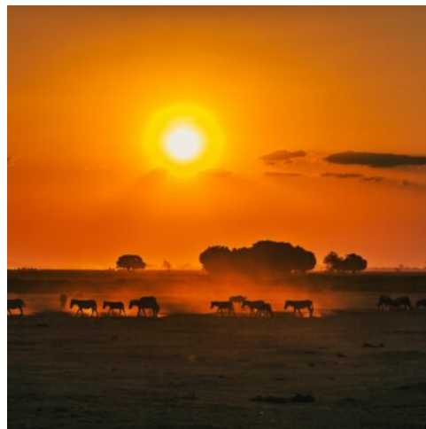
Sonnenuntergang in Kenia

Nach diesen vielfältigen Naturerlebnissen laden die kommenden Tage zum Erholen und Entspannen ein. Durch die faszinierende kenianische Landschaft fahren Sie nach Diani Beach an der Südküste des Landes. Genießen Sie den weiten weißen Sandstrand und das Türkisblau des Indischen Ozeans und stimmen Sie sich auf die kommenden Tage ein. (F M A)