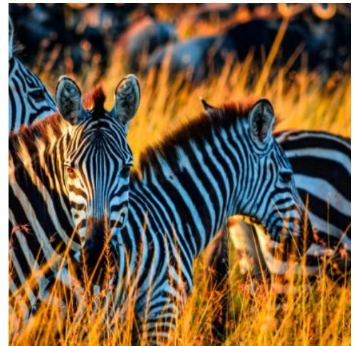
Naturschutzgebiet Masai Mara, Kenia

Genießen Sie bei einem Frühstück noch einmal den Ausblick auf den Kilimandscharo, ehe Sie weiter in Richtung Osten fahren. Als größter und ältester Nationalpark Kenias begrüßt Sie der in Ost und West geteilte Tsavo-Nationalpark heute auf 22.000 km 2 mit fantastischen Landschaften. Weite Steppen wechseln sich mit Akazienwäldern und großen Seen ab, in denen sich Flusspferde tummeln und Büffel und Nashörner Erfrischung suchen. Felsschluchten und Inselberge prägen die Landschaft des Tsavo East-Nationalparks. Halten Sie die Augen offen und beobachten Sie Leoparden auf der Pirsch durch das hohe Grasland und Löwenrudel, die unter den Bäumen Schatten suchen. (F M A)