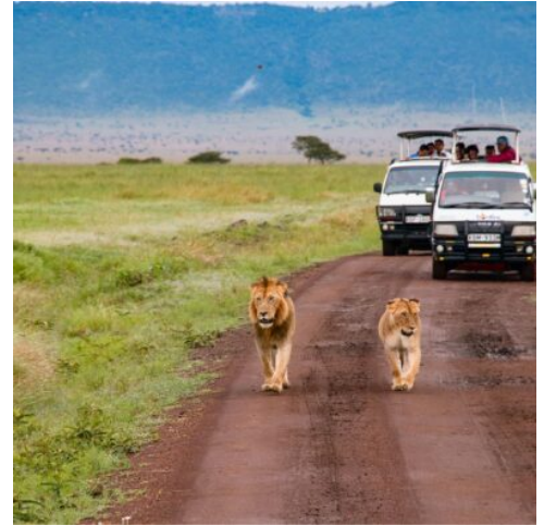
Masai Mara Nationalpark in Kenia

Nach dem Frühstück verlassen Sie die Masai Mara und fahren in Richtung Nordosten, ins Hochland des Ostafrikanischen Grabens, wo Sie der gewaltige Lake Naivasha erwartet. Als höchstgelegener Süßwassersee des Landes versammelt der See an seinen Ufern eine einzigartige Tierwelt und eine spektakuläre Landschaft, die Sie heute bei einer Bootsfahrt in vollen Zügen genießen können. Flusspferde schwimmen im klaren Wasser, Büffel und Wasserböcke suchen Abkühlung und auch Löwen sonnen sich an den Ufern. Besonders bekannt ist der See für seine mehr als 400 Vogelarten, die an seinen Ufern leben und nisten. Erkunden Sie die Umgebung Ihrer Lodge am Nachmittag auf eigene Faust und erleben Sie die faszinierende kenianische Natur in Ihrem eigenen Tempo. (F M A)