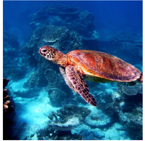
Great Barrier Reef

Heute ist der Weg das Ziel: 20 km hinter der Hafenstadt Geelong beginnt eine der schönsten Küstenstraßen der Welt, die Great Ocean Road. Sie passieren idyllische Küstenorte und schöne Sandstrände und bekommen atemberaubende Ausblicke auf die gurgelnde „Loch Ard Gorge“ und die (noch) der Brandung trotzbenden „12 Apostel“. Sie wurden im Laufe der Jahrtausende bizarr von Wind und Wellen aus der Felsküste geschliffen. (F)