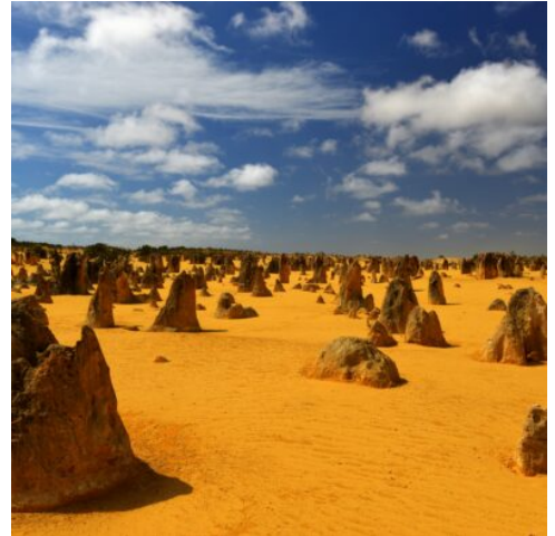
Pinnacles im Nambung Nationalpark

Eine Busrundfahrt zeigt Ihnen die freizeithlich gestimmte Stadt von den schönsten Seiten. Sie sehen Scarborough Beach und die historische Hafenstadt Fremantle. Im Shipwrecks Museum wird die abenteuerliche Seefahrtsgeschichte in westaustralischen Gewässern lebendig. Mit dem Boot fahren Sie auf dem Swan River zum zentral gelegenen Pier in Perth. (F)