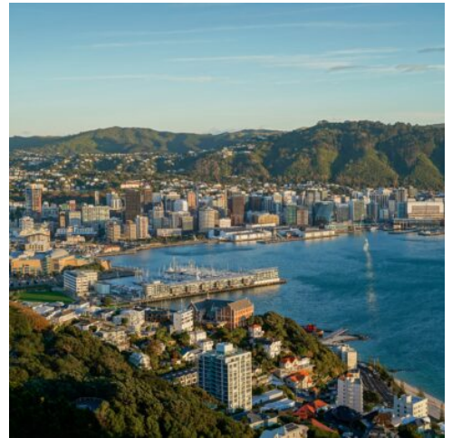
The, Central, Business, District, Is, Surrounded, By, Hi...

Am frühen Morgen können Sie sich einem Bootsausflug zum „Whale Watch“ (optional und witterungsabhängig) anschließen. Weiterfahrt durch die Provinz Marlborough mit Rebefeldern so weit das Auge reicht. In Havelock erreichen Sie noch einmal die idyllischen Marlborough Sounds. Der kleine Küstenort lebt mit und von der Muschelzucht (greenshell mussels) in den kühlen Wassern des Pelorus-Fjords. Die heutige Etappe endet an der oft sonnigen Tasman Bay – in Nelson, wo die zahlreichen Künstler und Kunsthandwerker für ein ganz besonderes Flair sorgen. (F A)