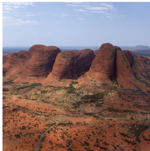
Amazing, Kata, Tjuta, Rock, Formation, With, Uluru, In

Flug von Sydney nach Alice Springs. Ein Besuch beim Royal Flying Doctor Service gehört hier zum Pflichtprogramm. Mit der abenteuerlichen Historie der Outback-Stadt macht dann die alte Telegrafstation vertraut. Es folgt der Besuch des einzigartigen „Desert Park“. In den Freigehegen, die typisch australische Landschaften widerspiegeln, kann man hier viele endemische Tier- und Vogelarten beobachten. (F A)