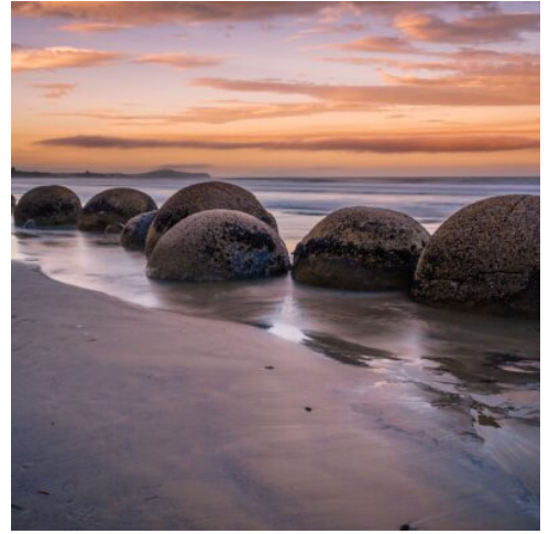
The, Round, Stones, On, The, Water's, Surface., Moer...

Die Hauptstadt Neuseelands hat allerhand zu bieten. Erkunden Sie Wellington auf eigene Faust! Schlendern Sie die schöne Hafensperrmauer entlang und entdecken in der City gut erhaltene viktorianische Architektur. (F)