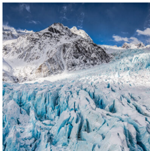
Franz Josef Gletscher

Fahrt nach Wairakei mit Besuch der Māori des Ngāti-Tuwharetoa-Stammes. Nach der traditionellen Begrüßung besteht hier die einmalige Gelegenheit zu einem Gespräch und Gedankenaustausch mit einem Stammesältesten. Abgerundet wird Ihr Besuch mit einem „Morning Tea“. Vorbei an den mächtigen Huka Falls geht es weiter zum Lake Taupo, Neuseelands größtem See. Sein Ufer begleitet eine ganze Zeit lang die Busfahrt zum Tongariro Nationalpark, wo drei noch immer recht aktive Vulkane das Zentralplateau der Nordinsel prägen: Ruapehu, Ngauruhoe und Tongariro im älteste Nationalpark Neuseelands, der zum UNESCO Naturerbe gehört. (F A)