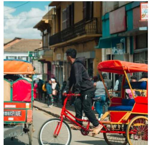
Fahrrad-Rikschas in Antsirabe