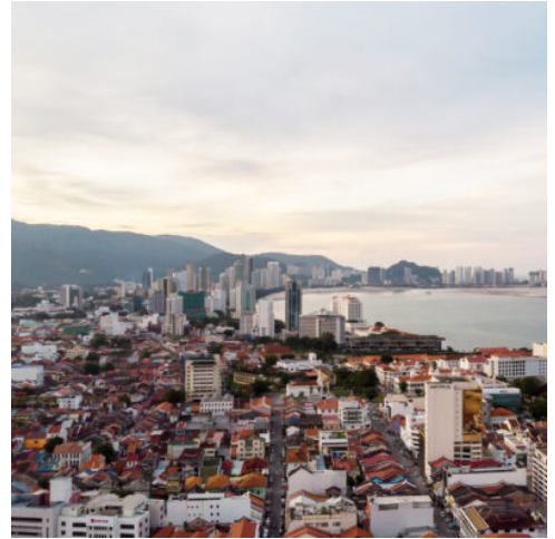
Malaysia Reise - Georgetown in Penang

Raue Berge und der wilde Regenwald begleiten Sie auf Ihrer Weiterreise auf die Insel Penang, wo Sie die farbenfrohe Provinzhauptstadt George Town begrüßt, in der sich die verschiedensten Kulturen und Religionen vereinen. Im Tempel Wat Chayamangkalaram erwartet Sie die gewaltige Statue eines Liegenden Buddhas, das Fort Cornwallis erinnert an die koloniale Vergangenheit der Insel. Vor der Küste von George Town lockt das malerische schwimmende Dorf Clan Jetties mit traditionellen Pfahlhäusern. Schlendern Sie durch die Straßen und lassen Sie sich von der farbenfrohen Straßenkunst bezaubern, die George Town an jeder Ecke in neue Farben taucht. Das Khoo Kongsi präsentiert sich mit fein gearbeiteter chinesischer Architektur. Anschließend weiß der Kek-Lok-Tempel ein Stück außerhalb der Stadt als einer der schönsten buddhistischen Tempel Südostasiens zu begeistern. Spektakulär erhebt sich die reich verzierte siebenstöckige Pagode in den Himmel, eine wundervolle Mischung aus chinesischer, thailändischer und burmesischer Architektur. (F M)