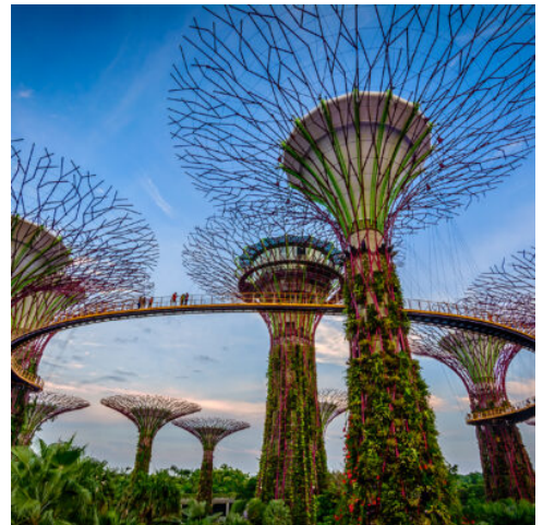
Singapur Reise - Mariana Bay in Singapur

Genießen Sie ein gemütliches Frühstück auf Penang, ehe Sie zurück nach Singapur fliegen. Gestalten Sie den Nachmittag in der vielseitigen Metropole ganz nach Ihren Vorlieben. Charmante Cafés und Restaurants begeistern mit einem bunten Mix aus den verschiedensten kulinarischen Einflüssen, mit futuristischen Hochhäusern und luxuriösen Geschäften lädt die Marina Bay zu einem Straßenbummel ein und das Viertel Little India verzaubert als ein Stückchen Indien im Herzen von Singapur. (F)