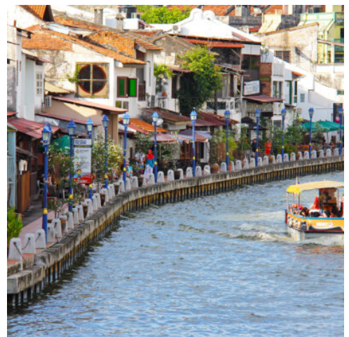
Malaysia Reise - Malakka River

Der heutige Tag wartet mit zahlreichen kulturellen Entdeckungen auf. Den Auftakt bildet der Cheng Hoon Teng Tempel, der älteste noch aktive chinesische Tempel Malaysias, der mit seiner traditionell chinesischen Architektur bezaubert. Nicht weit von hier verbindet die Kampung Kling Moschee indonesische, chinesische und malaysische Einflüsse miteinander. Ein besonderes Highlight Malakkas ist die Jonker Street, die mit charmanten Antiquitätenläden lockt. Das rote Stadthuys und der Glockenturm erinnern ebenso wie die Ruinen des Porta De Santiago an die koloniale Geschichte Malaysias. Nach dem Mittagessen fahren Sie weiter in die pulsierende malaysische Hauptstadt Kuala Lumpur. Der Rest des Tages steht Ihnen zur freien Verfügung – Zeit genug, um die hochmoderne Stadt auf eigene Faust zu erkunden. (F M)