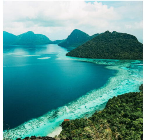
Malaysia Reise - Kinabatangan River

Morgennebel treibt über dem Wasser des Kinabatangan, während Sie zu einer ersten Wildbeobachtung aufbrechen. Auf einem nahen See erleben Sie aus nächster Nähe, wie die Natur erwacht, wie die Vögel ihr erstes Morgenlied anstimmen und zahlreiche Tiere an die Ufer des Sees strömen, um sich zu erfrischen. Eine leichte Wanderung durch den Dschungel lässt Sie noch tiefer in diese fantastische Wildnis eintauchen. Zurück in Ihrer Lodge erwartet Sie ein gemütliches Frühstück. Der Nachmittag steht Ihnen zur freien Verfügung. Erkunden Sie die spektakulären Flusslandschaften auf eigene Faust, besuchen Sie das nahe Dorf oder genießen Sie einfach das beruhigende Rauschen des Flusses. Später entführt Sie eine Bootsfahrt erneut in die wundervolle Welt des Flusses und des wilden Regenwaldes. (F M A)