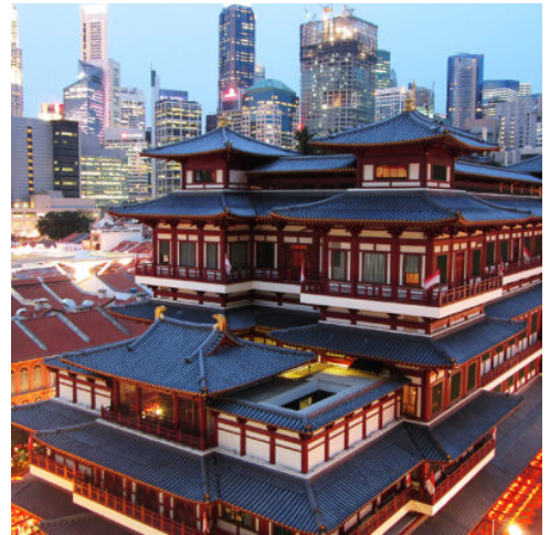
Singapur Reise - Chinatown in Singapur

Bei Ihrer Landung am Flughafen von Singapur werden Sie bereits erwartet und zu Ihrem Hotel gefahren. In der Weltmetropole vor der Küste Malaysias, die durch ihren rasanten wirtschaftlichen Aufschwung internationale Berühmtheit erlangte, vereinen sich westliche und östliche Einflüsse zu einem einzigartig modernen Stadtbild, das mit seiner futuristischen Architektur dazu einlädt, entdeckt zu werden.